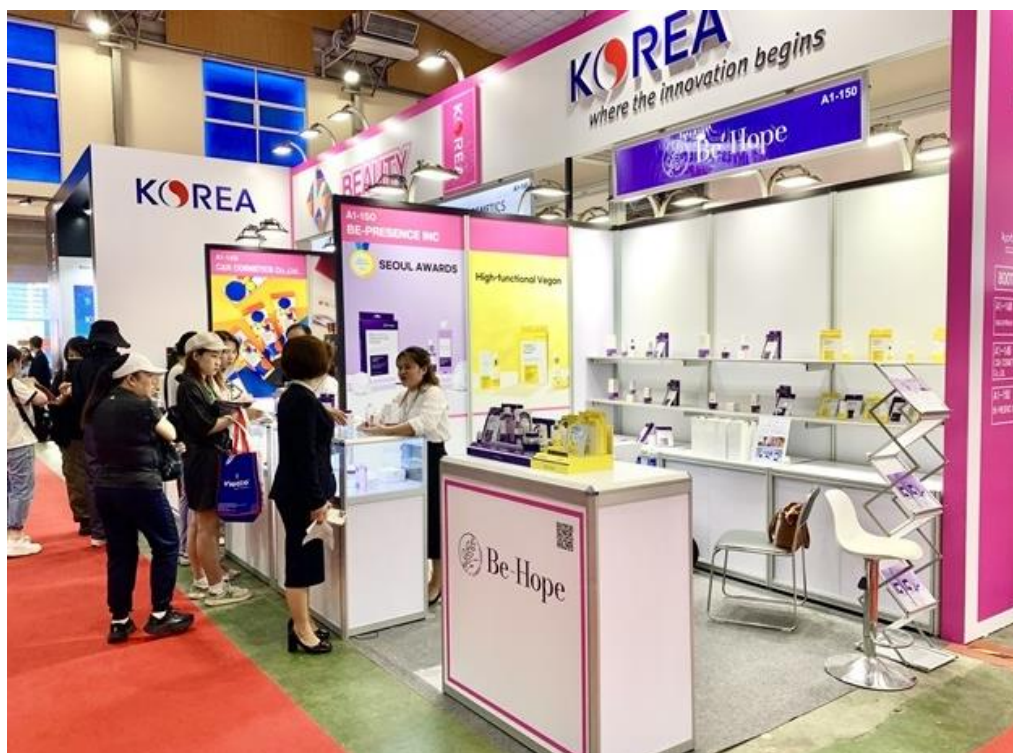
Gian hàng sản phẩm công nghệ và giải pháp sáng tạo Hàn Quốc tại sự kiện (Ảnh: SGGP).