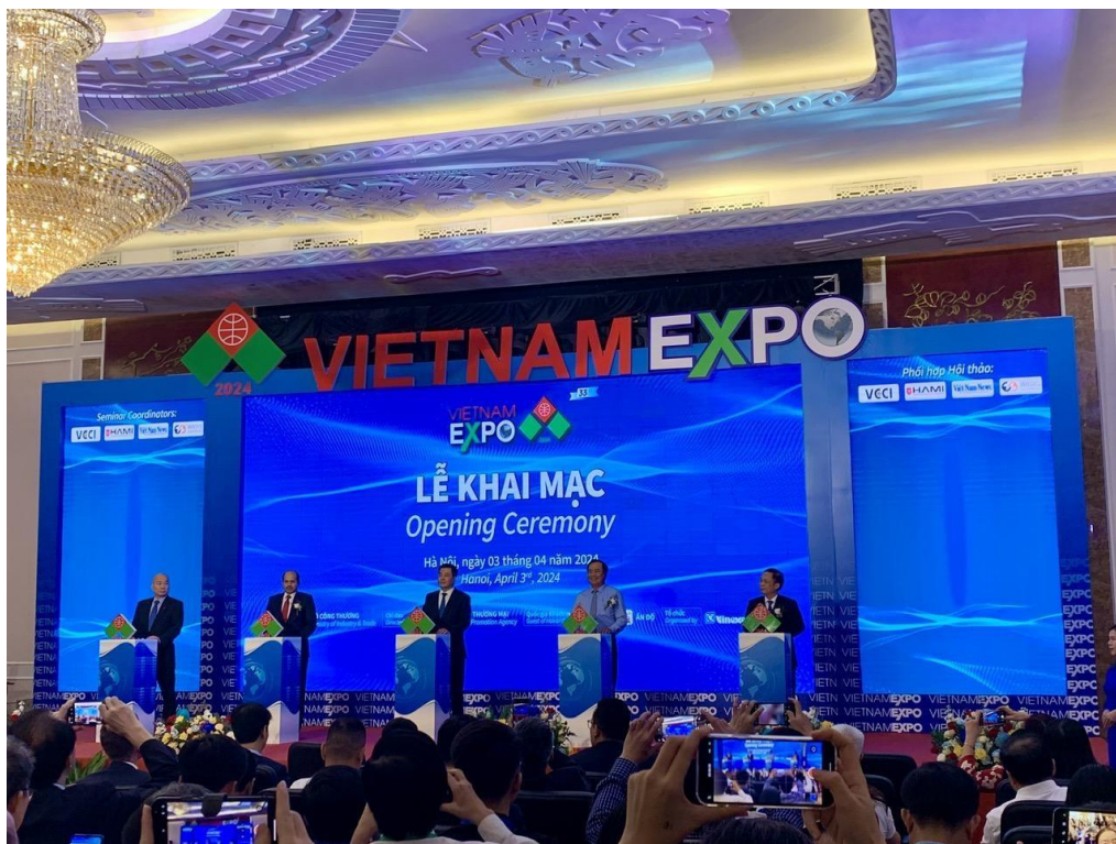
Lễ khai mạc Vietnam Expo 2024.