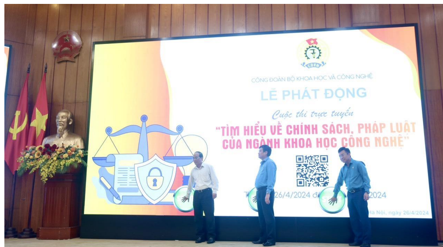
Các đại biểu ấn nút khởi động cuộc thi.

Cuộc thi sẽ tập trung tìm hiểu nội dung về các Luật: KH&CN; Chuyển giao công nghệ; Sở hữu trí tuệ; Năng lượng nguyên tử; Tiêu chuẩn và quy chuẩn kỹ thuật; Đo lường; Công nghệ cao; Chất lượng sản phẩm hàng hóa và các văn bản quy phạm pháp luật về ngành KH&CN.