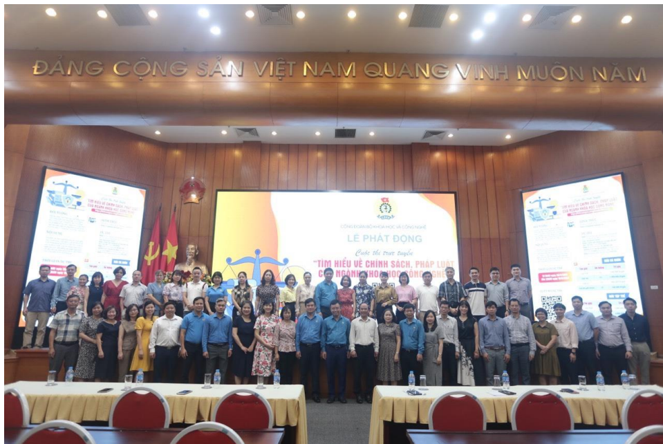
Các đại biểu chụp ảnh tại lễ phát động.

Lễ trao giải thưởng được tổ chức vào ngày 18/5/2024 tại Nhà thi đấu quận Cầu Giấy.