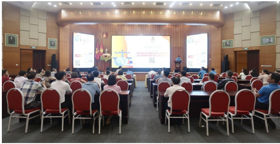
Toàn cảnh Lễ phát động.

Cuộc thi được tổ chức theo hình thức trắc nghiệm trực tuyến trên trang thông tin điện tử của Công đoàn Bộ KH&CN tại địa chỉ https://congdoan.most.gov.vn và sẽ kết thúc vào ngày 16/5/2024.