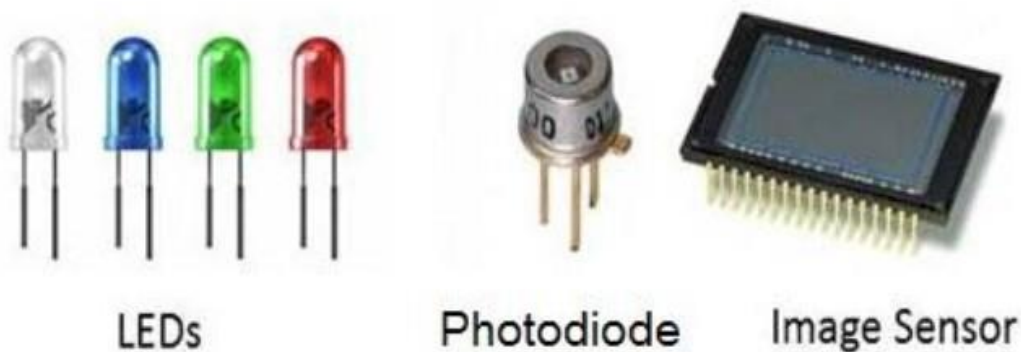
Hình 1. Các thành phần chính của hệ thống Li-Fi.

Công nghệ Li-Fi được thực hiện bằng cách sử dụng bóng đèn LED trắng chiếu sáng với dòng điện không đổi. Bằng cách thay đổi nhanh dòng điện, đầu ra ánh sáng có thể thay đổi ở tốc độ cao. Nếu đèn LED bật thì truyền đi bit 1, nếu đèn LED tắt thì truyền đi bit 0; các đèn LED có thể bật và tắt với tần số rất cao, do đó có thể truyền dữ liệu với tốc độ cực nhanh. Bên cạnh đó, có thể mã hóa dữ liệu trong ánh sáng bằng cách thay đổi tốc độ bật và tắt đèn LED để tạo ra các chuỗi 1 và 0 khác nhau. Cường độ LED được điều chế nhanh đến mức mắt người không thể nhận thấy, vì vậy đầu ra xuất hiện không đổi. Có thể tăng đáng kể tốc độ dữ liệu Li-Fi bằng cách sử dụng các dây (màng) đèn LED; trong đó, mỗi đèn LED truyền một luồng dữ liệu khác nhau. Ngoài ra, có thể sử dụng hỗn hợp đèn LED đỏ, lục và lam để thay đổi tần số ánh sáng mã hóa các kênh dữ liệu khác nhau. Bóng đèn LED sẽ chứa một chip siêu nhỏ thực hiện công việc xử lý dữ liệu. Cường độ sáng có thể được điều chỉnh để gửi dữ liệu bằng những thay đổi nhỏ về biên độ.