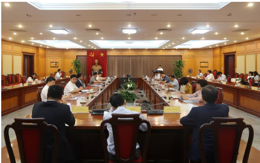
Toàn cảnh buổi Lễ bổ nhiệm.