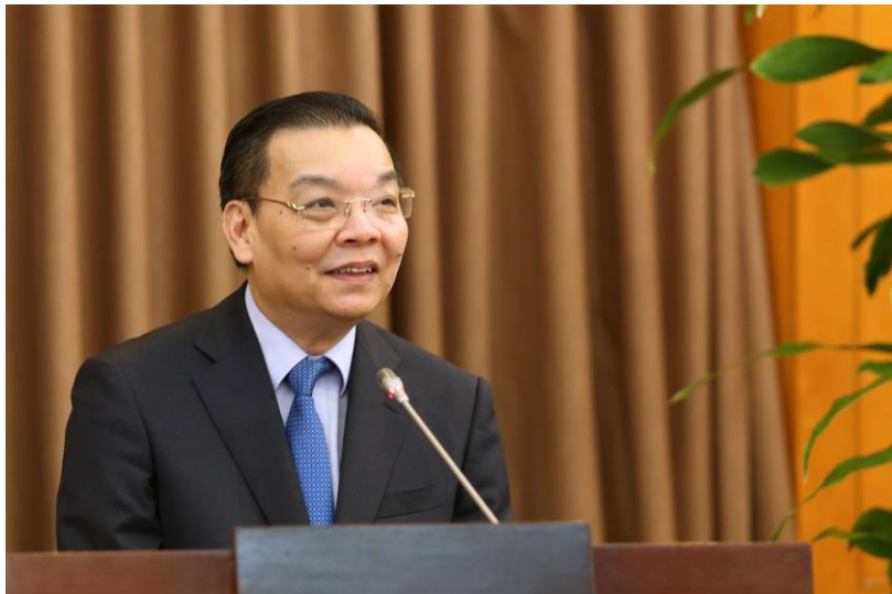
Bộ trưởng Bộ Khoa học và Công nghệ Chu Ngọc Anh chúc mừng các đồng chí được bổ nhiệm.