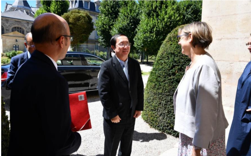
Bộ trưởng Bộ Đại học và Nghiên cứu Pháp Sylvie Retailleau chào đón Bộ trưởng Huỳnh Thành Đạt từ công vào Tòa nhà Trụ sở Bộ

Tại Cộng hòa Pháp, Bộ trưởng Huỳnh Thành Đạt đã có buổi hội đàm song phương với Bộ trưởng Bộ Đại học và Nghiên cứu Pháp Sylvie Retailleau, thăm và làm việc với một số cơ quan, tổ chức trong hệ thống sáng tạo quốc gia Pháp trong đó có Trung tâm nghiên cứu vũ trụ quốc gia Pháp, Ủy ban quốc gia về năng lượng nguyên tử và năng lượng thay thế tại Grenoble, Trung tâm đổi mới sáng tạo Inovallee, Tổng Công ty quốc phòng và vũ trụ của Tập đoàn Airbus, Ngân hàng đầu tư công Pháp - BPI France. Các buổi làm việc diễn ra trong không khí hợp tác chân thành, hiểu biết lẫn nhau và thực chất.