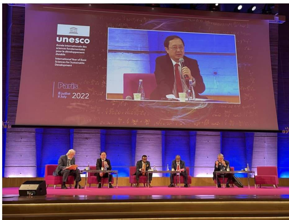
Bộ trưởng Huỳnh Thành Đạt phát biểu tại Tọa đàm cấp cao trong khuôn khổ Lễ khai mạc Năm quốc tế vì sự phát triển bền vững do UNESCO tổ chức sáng ngày 8/7/2022 tại Paris, Cộng hòa Pháp

Tham dự Lễ Khai mạc Năm quốc tế về Khoa học cơ bản vì sự phát triển bền vững 2022 do UNESCO chủ trì tổ chức và Tọa đàm cấp cao về “Vai trò của khoa học trong hoạch định chính sách”, Bộ trưởng Huỳnh Thành Đạt đã tham gia thảo luận cùng các khách mời là Lãnh đạo cấp cao của một số nước thành viên UNESCO, trong đó có Bộ trưởng Bộ Khoa học và Công nghệ của các nước Trung Quốc, Cuba, Nam Phi, Nigeria, Honduras. Chia sẻ về các bài học rút ra từ đại dịch Covid-19 dẫn tới sự thay đổi mối quan hệ giữa khoa học và hoạch định chính sách, Bộ trưởng Huỳnh Thành Đạt nhấn mạnh tầm quan trọng của việc phải mạnh mẽ đổi mới tư duy trong quản lý khoa học và công nghệ, khuyến khích thử nghiệm, chấp nhận rủi ro và thất bại, đồng thời, thúc đẩy tinh thần khoa học mở và đổi mới sáng tạo mở. Bộ trưởng cũng đề xuất hình thành các nền tảng chia sẻ thông tin sáng chế, dữ liệu, công bố khoa học và phương tiện nghiên cứu nhằm giúp các nước chậm phát triển hơn có thể tiếp cận và bắt kịp với xu hướng phát triển của khoa học và công nghệ thế giới. Cuối cùng, Bộ trưởng nhấn mạnh vấn đề lựa chọn ưu tiên và cân bằng giữa tăng trưởng kinh tế với đảm bảo an toàn, an ninh cho người dân, trong đó, cần đặt người dân và con người vào trung tâm của mọi chính sách phát triển.