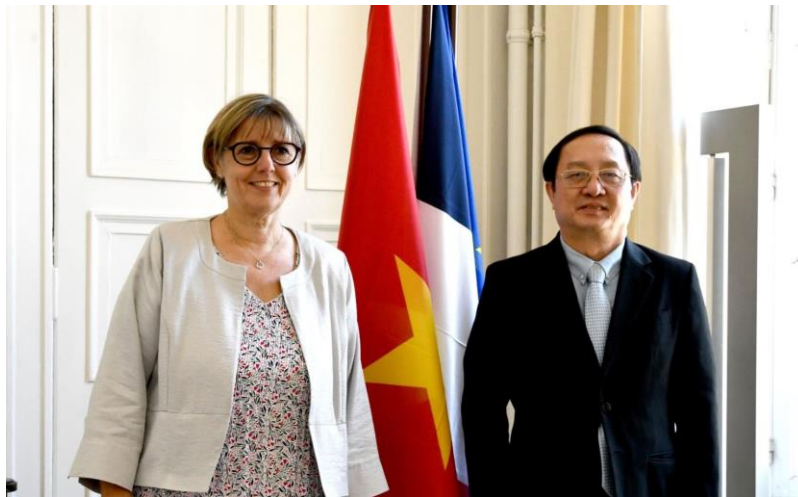
Bộ trưởng Huỳnh Thành Đạt và Bộ trưởng Sylvie Retailleau chụp ảnh chung trước Hội đàm