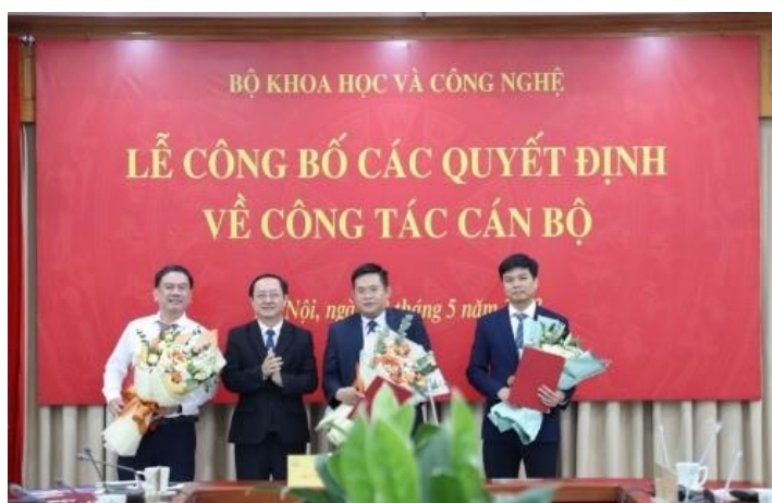
Bộ trưởng Huỳnh Thành Đạt trao Quyết định bổ nhiệm Lãnh đạo một số đơn vị thuộc Bộ.