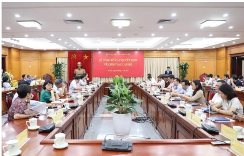
Toàn cảnh buổi Lễ.

Ngày 8/5/2023, tại Hà Nội, Bộ Khoa học và Công nghệ (KH&CN) đã tổ chức Lễ công bố các Quyết định điều động, bổ nhiệm lãnh đạo một số đơn vị thuộc Bộ.