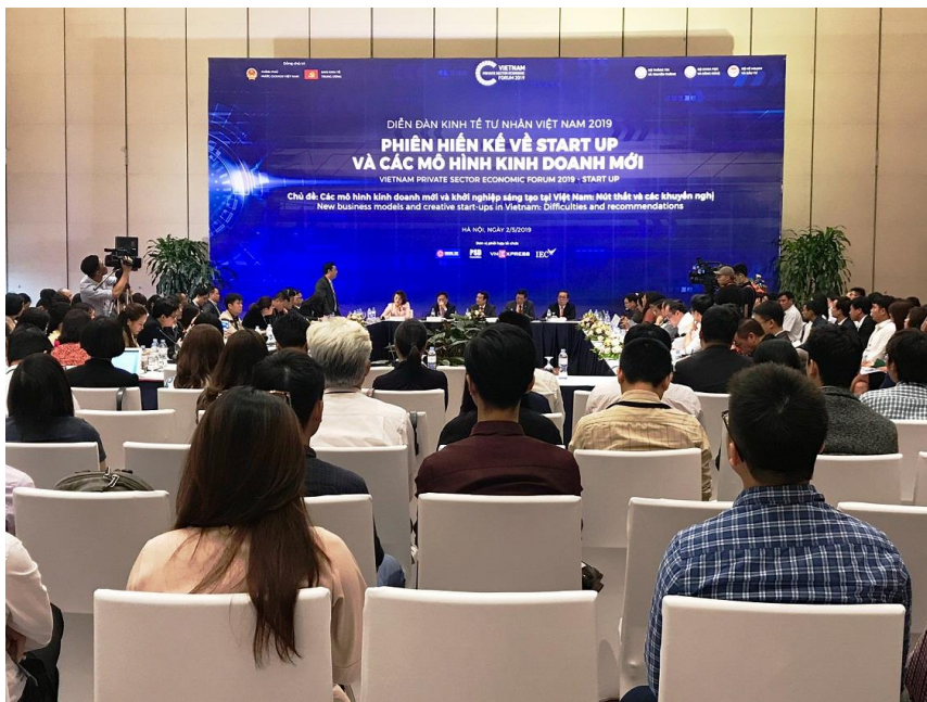
Toàn cảnh Phiên hiến kế về khởi nghiệp và các mô hình kinh doanh mới tại Việt Nam.