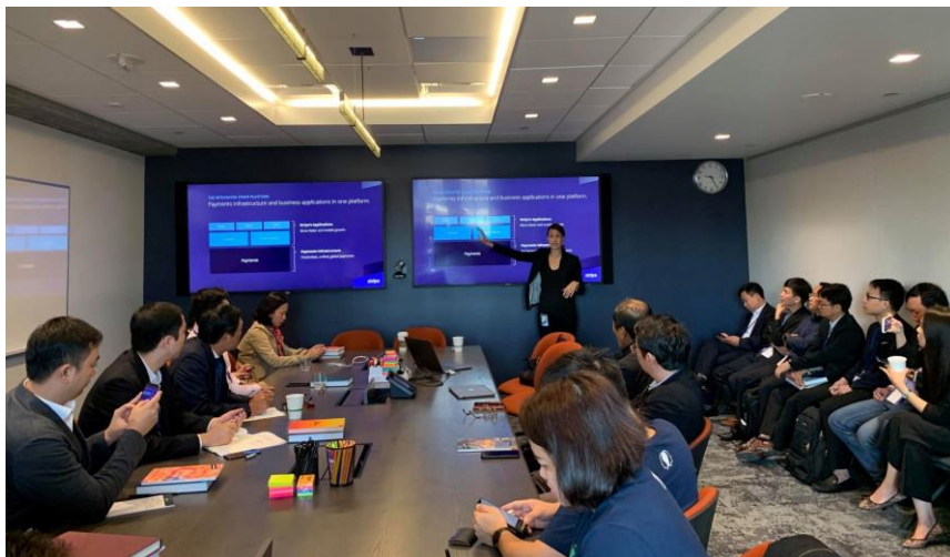
Bộ KH&CN làm việc với đối tác Stripe tại Hoa Kỳ về chương trình nghiên cứu doanh nghiệp khởi nghiệp ứng dụng nền tảng số (ngày 11/09).

Việc thúc đẩy các hoạt động quốc tế này là hết sức phù hợp với định hướng phát triển hệ sinh thái khởi nghiệp sáng tạo Việt Nam kết nối toàn cầu, thúc đẩy kết nối nguồn lực nội tại và nguồn lực quốc tế của hệ sinh thái theo chỉ đạo của Đảng và nhà nước.