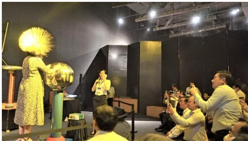
Du khách thích thú với cảm giác dòng điện lớn chạy trong người khiến tóc dựng đứng.