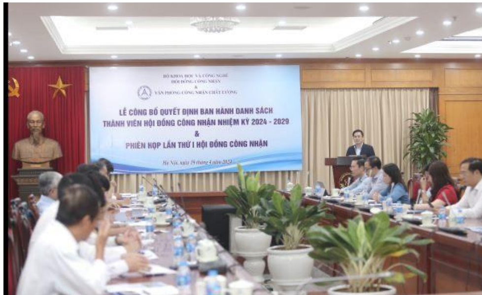
Toàn cảnh buổi Lễ.