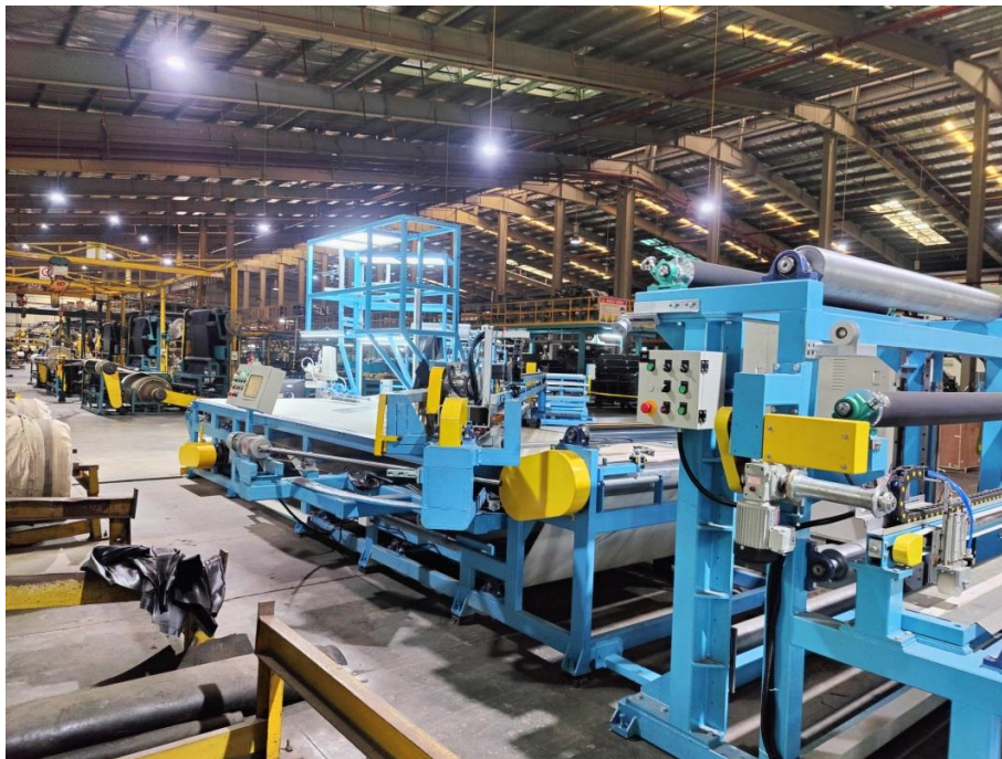
Dây chuyền cắt Bias do Viện Nghiên cứu Cơ khí thiết kế, chế tạo.

Với định hướng thiết kế nhằm nâng cao chất lượng, năng suất của dây chuyền cắt vải, Viện Nghiên cứu Cơ khí đã tiến hành thiết kế các thiết bị trong dây chuyền để có thể nâng cao năng suất cắt; mở rộng được chiều cắt ngang; thay đổi được góc cắt nhiều hơn... so với công nghệ hiện có, nhằm đa dạng hóa sản phẩm, đáp ứng được yêu cầu phát triển của ngành sản xuất lốp. Viện cũng tăng cường áp dụng hệ thống điều khiển tự động như tự động hóa hoàn toàn khâu ghép vải bằng cách dùng robot gấp và ghép vải mảnh, giúp giảm nhân công và chi phí năng lượng.