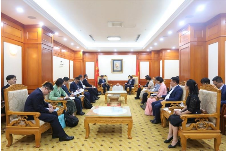
Toàn cảnh buổi tiếp.