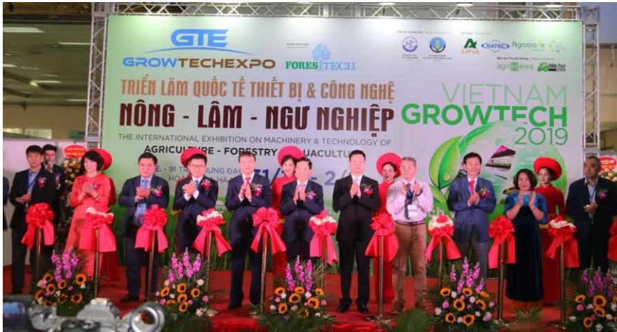
Các đại biểu cắt băng khai mạc Triển lãm.

Với mục tiêu nâng cao chất lượng sản phẩm cho các ngành nông lâm ngư nghiệp thông qua việc ứng dụng công nghệ, tạo nền tảng cho việc ra đời các sản phẩm có giá trị sử dụng cao, Growtech năm nay sẽ là địa chỉ đáng tin cậy để hỗ trợ xúc tiến thương mại giữa doanh nghiệp trong nước và quốc tế.