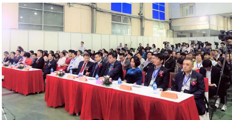
Toàn cảnh Triển lãm Vietnam Growtech 2019.

Với sự góp mặt các sản phẩm của các quốc gia và vùng lãnh thổ có nền khoa học kỹ thuật nông nghiệp thông minh như: Hà Lan, Israel, Pháp, New Zealand, Italia, Chile, Tây Ban Nha, Bồ Đào Nha, Nhật Bản, Hàn Quốc, Trung Quốc, Thái Lan, Malaysia, Đài Loan, Indonesia, Ấn Độ... Vietnam Growtech năm nay xứng đáng là địa chỉ tin cậy để hỗ trợ xúc tiến thương mại giữa nhiều doanh nghiệp trong nước và quốc tế. Đặc biệt, triển lãm có sự hiện diện của các doanh nghiệp khởi nghiệp của Việt Nam, thông qua các chương trình hỗ trợ từ Bộ Khoa học và Công nghệ (KH&CN).