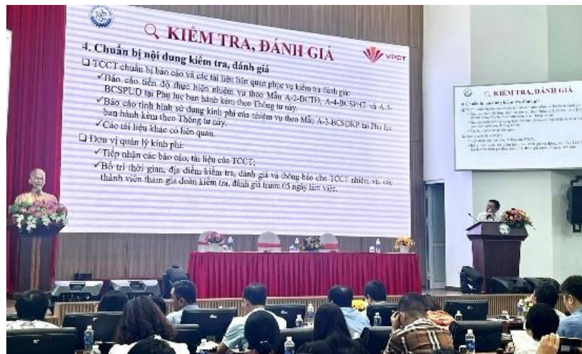
Báo cáo về công tác kiểm tra, đánh giá, điều chỉnh và chấm dứt hợp đồng trong quá trình thực hiện nhiệm vụ; lập báo cáo định kỳ, báo cáo nội dung, tiến độ thực hiện, xác nhận khối lượng công việc hoàn thành, nhật ký đề tài.