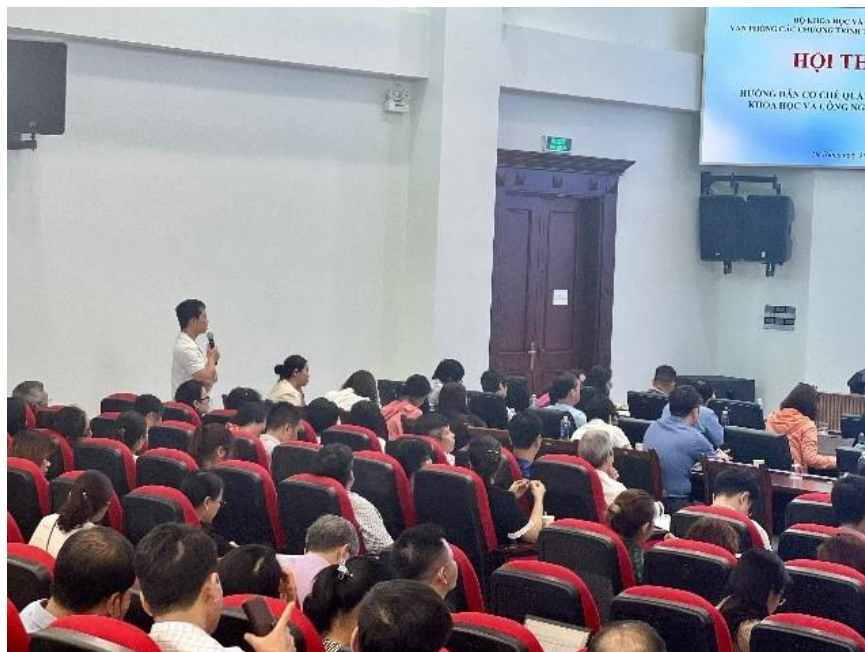
Các đại biểu trao đổi tại phần thảo luận của Hội thảo