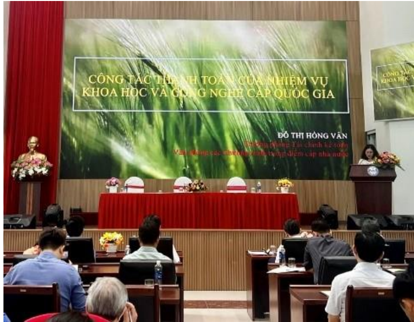
Báo cáo về công tác thanh quyết toán kinh phí thực hiện đề tài/dự án; quy trình thực hiện đấu thầu mua sắm hàng hóa (hóa chất, nguyên vật liệu, thiết bị...) thực hiện nhiệm vụ