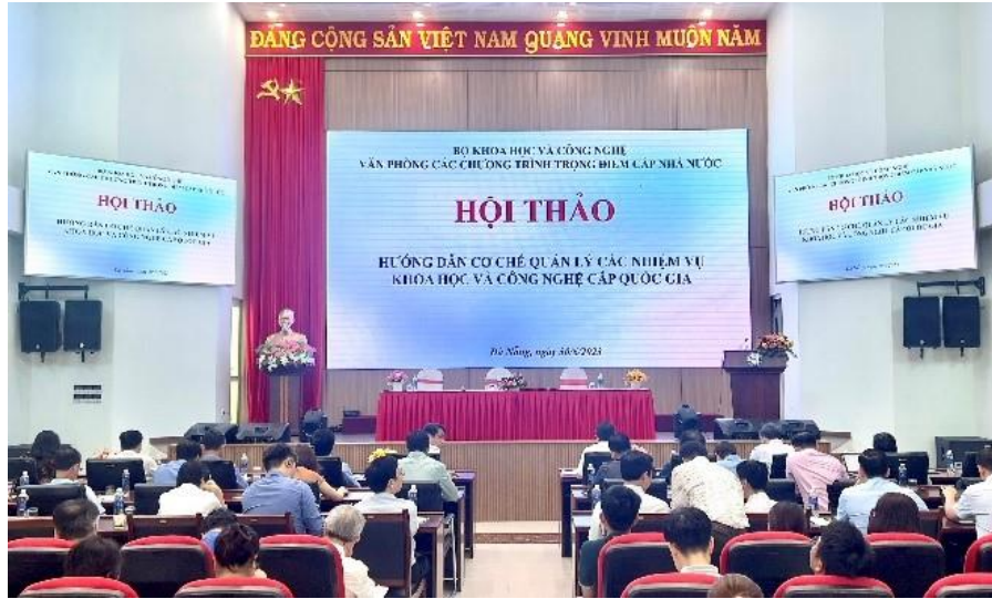
Toàn cảnh Hội thảo “Hướng dẫn cơ chế quản lý các nhiệm vụ khoa học và công nghệ cấp quốc gia” Tại Hội thảo, một số Báo cáo tham luận đã được trình bày: