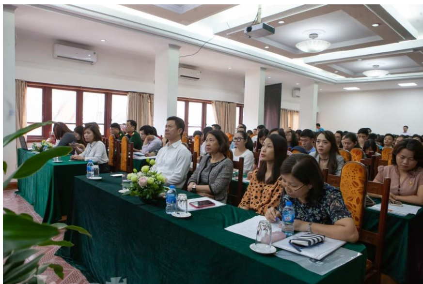
Toàn cảnh hội thảo

Hội thảo đã kết thúc thành công tốt đẹp với những đóng góp thiết thực cho hoạt động nghiên cứu và đào tạo. Các đại biểu đánh giá cao và đề xuất Cục Thông tin tổ chức nhiều hội thảo hơn để đưa các nguồn tin KH&CN trong nước và quốc tế quý báu tới cộng đồng các nhà khoa học Việt Nam.