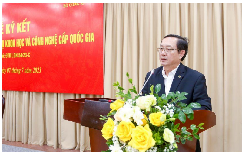
Bộ trưởng Huỳnh Thành Đạt phát biểu tại buổi Lễ.

phát từ yêu cầu thực tiễn, mang tính tổng thể, toàn diện, lâu dài, nền tảng cho công tác bảo vệ chủ quyền quốc gia trên không gian mạng hiện nay.