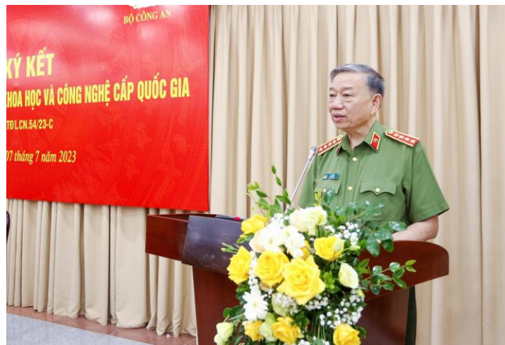
Bộ trưởng Tô Lâm phát biểu tại buổi Lễ.