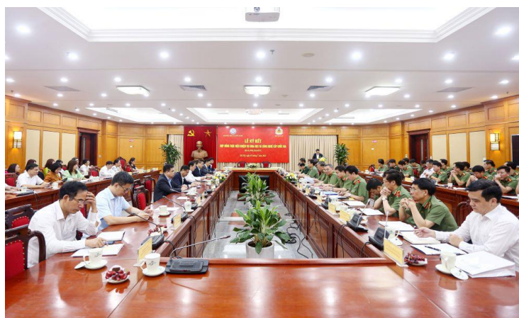
Toàn cảnh buổi Lễ.