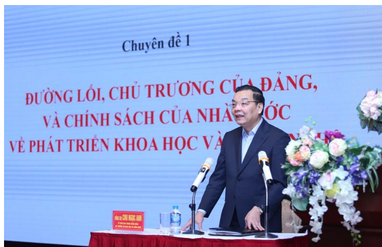
Bộ trưởng Chu Ngọc Anh phát biểu tại lớp Bồi dưỡng.

Từ ngày 02 – 06/12/2019 tại Thanh Hoá, Học Viện Khoa học, Công nghệ và Đổi mới sáng tạo (Bộ KH&CN) phối hợp với Sở KH&CN tỉnh Thanh Hóa tổ chức lớp “Bồi dưỡng nghiệp vụ quản lý nhà nước về KH&CN dành cho lãnh đạo Sở KH&CN”.