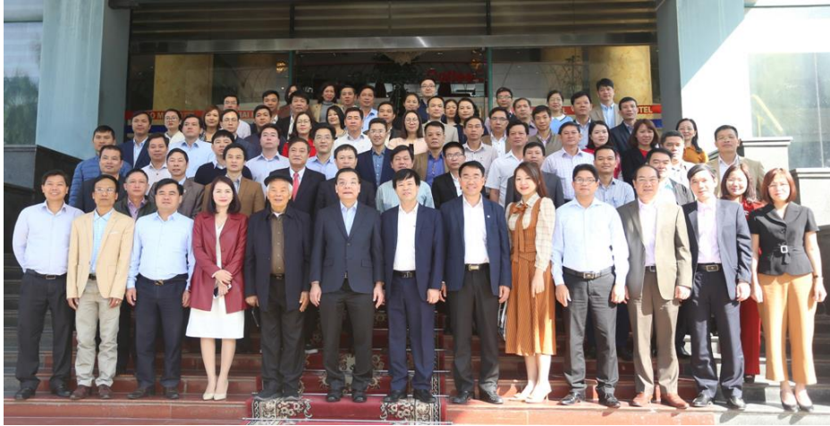
Bộ trưởng Chu Ngọc Anh chụp ảnh lưu niệm cùng các đại biểu.

Theo Ban tổ chức, việc tổ chức lớp Bồi dưỡng nhằm thực hiện chỉ đạo của Bộ trưởng Bộ KH&CN về bồi dưỡng nghiệp vụ cho chức danh giám đốc, phó giám đốc để đáp ứng tiêu chuẩn theo Thông tư số 06/2015/TT-BKH&CN ngày 26/3/2015 của Bộ KH&CN quy định tiêu chuẩn chức danh Giám đốc, Phó giám đốc Sở KH&CN thuộc UBND tỉnh, thành phố trực thuộc Trung ương.