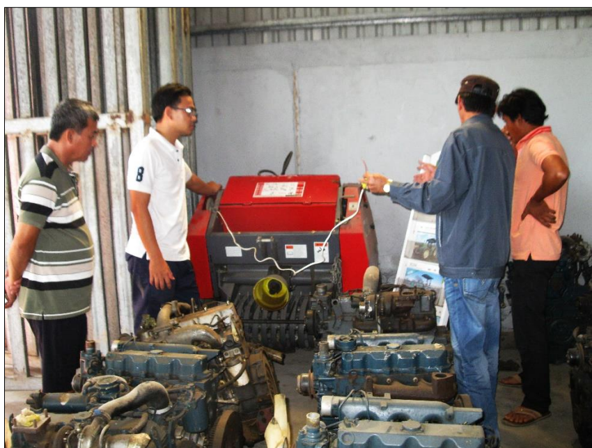
Nhân viên cửa hàng tư vấn kỹ thuật cho khách hàng

Ngày 04 tháng 02 năm 2020, Trung tâm Ứng dụng Tiến bộ Khoa học và Công nghệ An Giang (Agitech) đã tư vấn và kết nối thành công cho một nông dân trên địa bàn huyện An Phú tiến hành mua máy cuộn rơm tự động MAXXI-50 tại Cửa hàng Nông ngư cơ Thanh Tùng (Số 57 Quốc lộ 91, thị trấn An Châu, huyện Châu Thành, tỉnh An Giang).