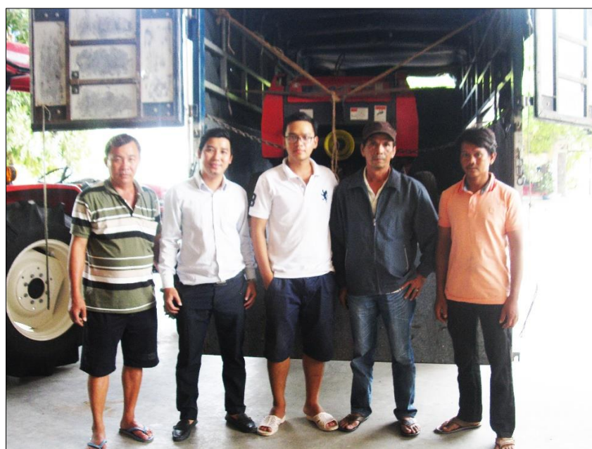
Hai bên đã tiến hành xong giao dịch thiết bị công nghệ tại Cửa hàng