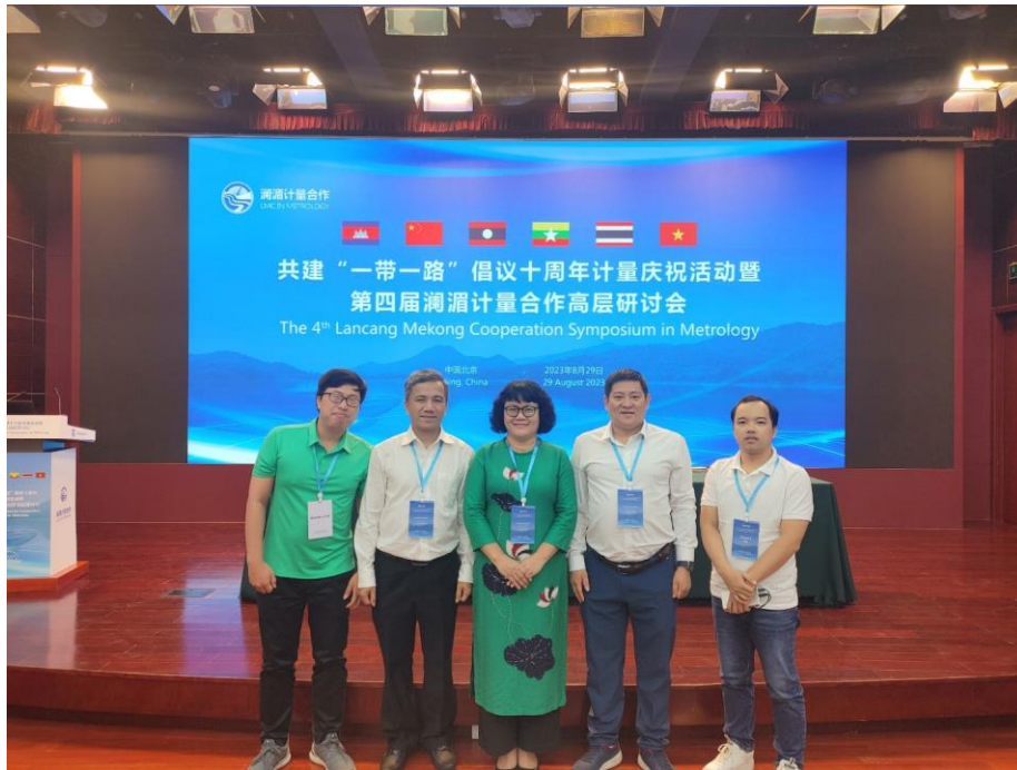
Lãnh đạo và cán bộ Viện Đo lường Việt Nam tham dự Hội nghị

Đại diện phía Việt Nam cũng đã thể hiện quyết tâm trong việc hợp tác đo lường thông qua các dự án nghiên cứu chung, chương trình đào tạo và trao đổi thông tin về quy trình, phương pháp đo. Sự hợp tác này không chỉ mang lại lợi ích cho chính phủ mà còn có tác động tích cực đến các ngành công nghiệp, tăng cường độ chính xác cho các phép đo và giúp tăng năng suất.