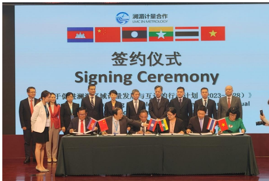
Lễ ký kết Chương trình hành động tăng cường tiến bộ về đo lường và thừa nhận lẫn nhau giữa các nước Lancang-Mekong

Tại Hội nghị, Viện Đo lường Việt Nam đã chính thức ký kết Biên bản với các đối tác quốc tế trong LMC nhằm tạo ra một nền tảng vững chắc cho sự hợp tác đo lường giữa các quốc gia trong khu vực này.