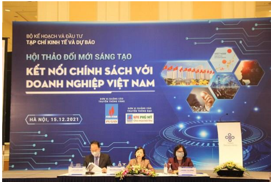
Hội thảo “Đổi mới sáng tạo: Kết nối chính sách với doanh nghiệp Việt Nam,” ngày 15/12.