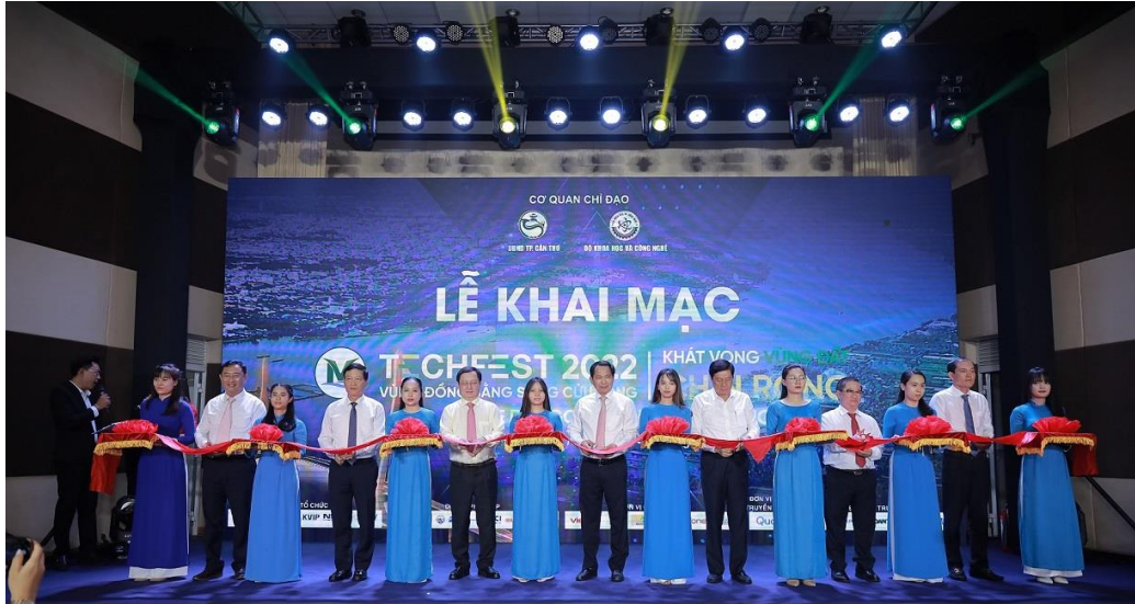
Các đại biểu cắt băng khai mạc.

Ngày 19-20/10/2022, Ngày hội khởi nghiệp Đổi mới sáng tạo Vùng Đồng bằng sông Cửu Long - Techfest Mekong 2022 với chủ đề “Khát vọng vùng đất Chín Rồng” dưới sự chỉ đạo của Ủy ban nhân dân thành phố Cần Thơ; Bộ Khoa học và Công nghệ, được tổ chức bởi Sở Khoa học và Công nghệ thành phố Cần Thơ (Sở KH&CN), Cục Phát triển thị trường và doanh nghiệp khoa học và công nghệ (Cục PTTTĐN), Trung tâm hỗ trợ khởi nghiệp sáng tạo quốc gia, Văn phòng Đề án 844, Chi nhánh Phòng Thương mại và Công nghiệp Việt Nam (VCCI) tại Cần Thơ, với sự đồng hành của Tập đoàn Qualcomm Việt Nam, các Làng công nghệ quốc gia, các nhóm khởi nghiệp cùng một số đại diện đại sứ quán, đại biểu trong, ngoài tỉnh. tại Vườn ươm Công nghệ Công nghiệp Việt Nam – Hàn Quốc.