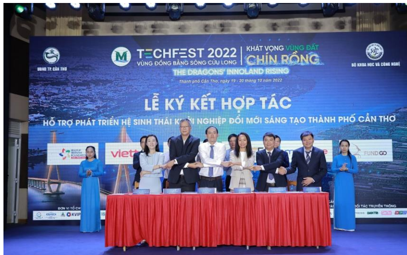
Các đơn vị ký kết hợp tác hỗ trợ phát triển hệ sinh thái khởi nghiệp ĐMST TP Cần Thơ.