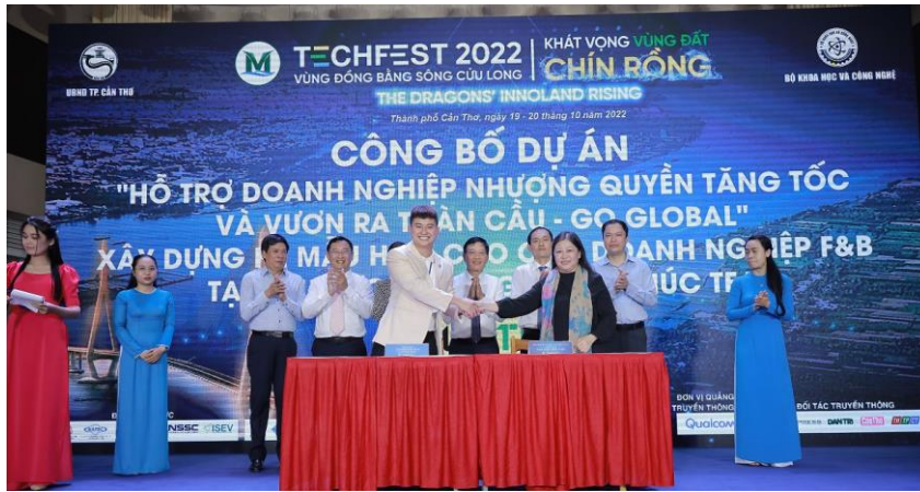
Công bố dự án “hỗ trợ doanh nghiệp nhượng quyền tăng tốc và vươn ra toàn cầu – Go Global”.