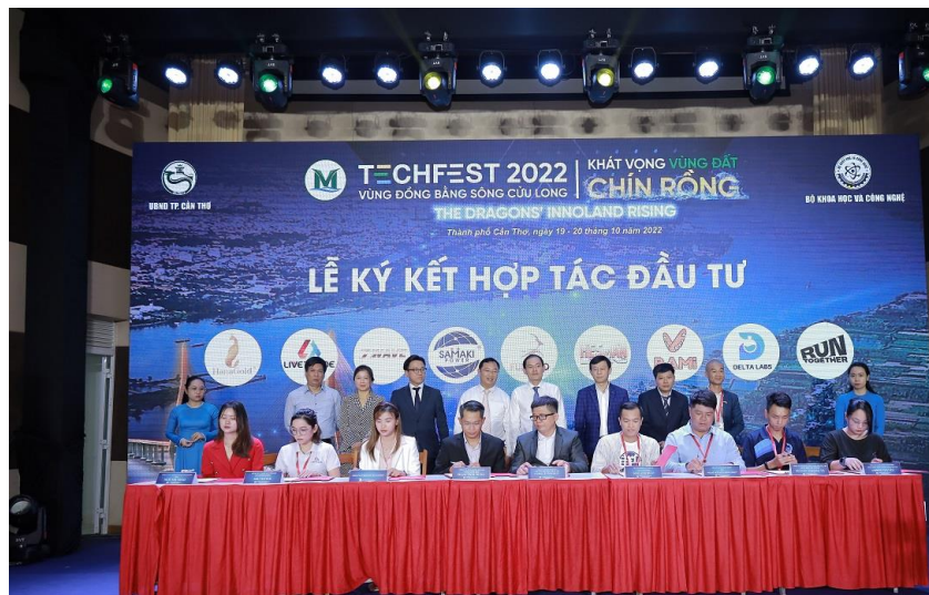
Các đơn vị ký kết hợp tác đầu tư.