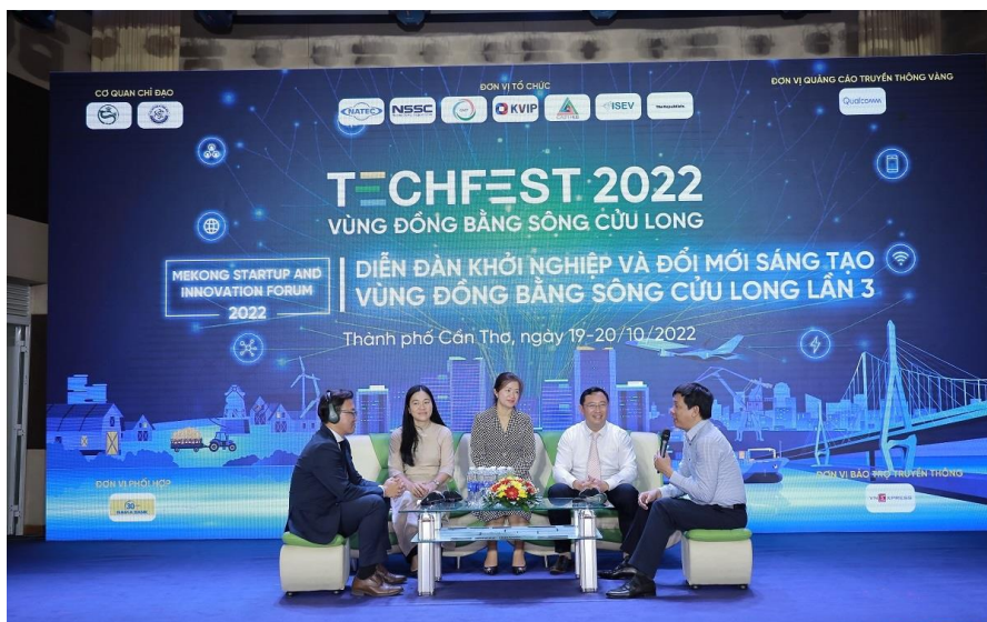
Các diễn giả tham gia Diễn đàn khởi nghiệp và ĐMST vùng Đồng bằng sông Cửu Long lần thứ 3

Techfest Mekong 2022 quy tụ các đơn vị, cá nhân tham gia trưng bày với hơn 100 gian triển lãm, trưng bày trực tiếp và 30 gian triển lãm trực tuyến giới thiệu các sản phẩm, dự án KNDMST, sản phẩm KH&CN của vùng ĐBSCL, trong nước và quốc tế. Qua đó, kết nối sản phẩm đến người tiêu dùng, nhà quản lý, nhà khoa học, cộng đồng doanh nghiệp góp phần thúc đẩy phát triển, mở rộng thị trường, định hướng phát triển cho các sản phẩm/dịch vụ của doanh nghiệp khởi nghiệp trong thời gian tới.