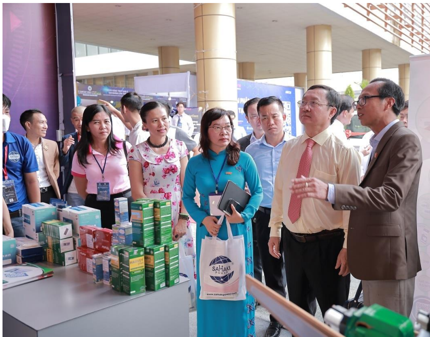
Bộ trưởng Huỳnh Thành Đạt và các đại biểu thăm quan các gian hàng triển lãm.