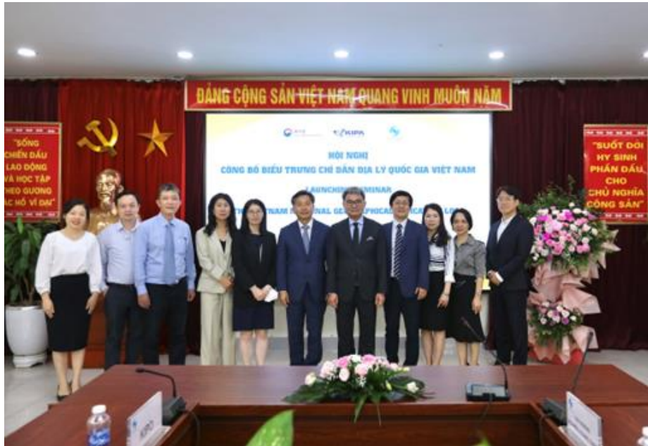
Các đại biểu tại Hội nghị công bố Biểu trưng chỉ dẫn địa lý quốc gia Việt Nam.