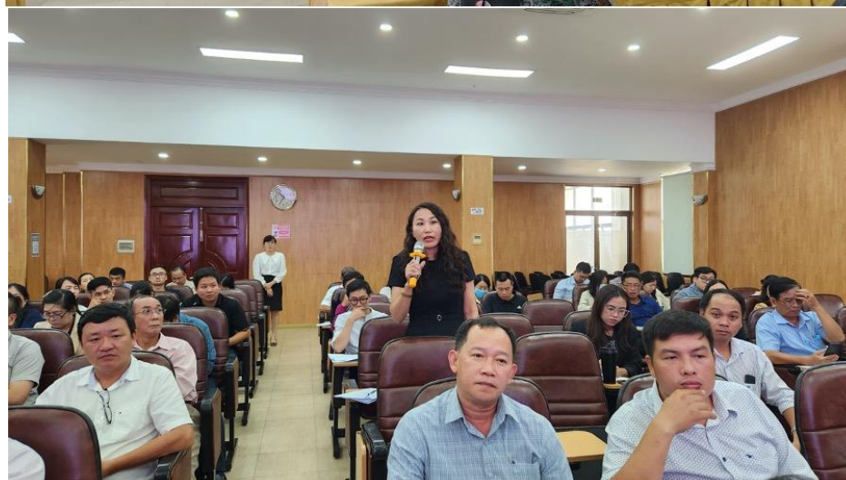
Các đại biểu tham dự Hội thảo.