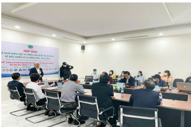
Toàn cảnh buổi họp báo

TS. Nguyễn Quân, nguyên Bộ trưởng Bộ Khoa học và Công nghệ, Chủ tịch Hội Tự động hóa Việt Nam (VAA), Chủ tịch hội nghị VCAA cho biết tại buổi họp báo ngày 25/3/2022 diễn ra tại Hà Nội. VCCA sẽ diễn ra ngày 8-9/4 tại Thành phố Hồ Chí Minh, đây là sự kiện do VAA chủ trì, tổ chức 2 năm một lần (sau khi tạm hoãn hồi tháng 11/2021 vì Covid-19). Sự kiện thu hút 70 gian hàng triển lãm các công nghệ, sản phẩm mới của doanh nghiệp trong nước, các viện trường, địa phương.