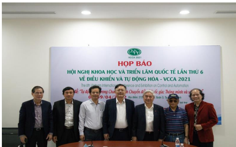
Các đại biểu tham dự chụp ảnh lưu niệm

Chương trình hội nghị khoa học và Diễn đàn doanh nghiệp được tổ chức đồng thời hai hình thức trực tiếp và trực tuyến.