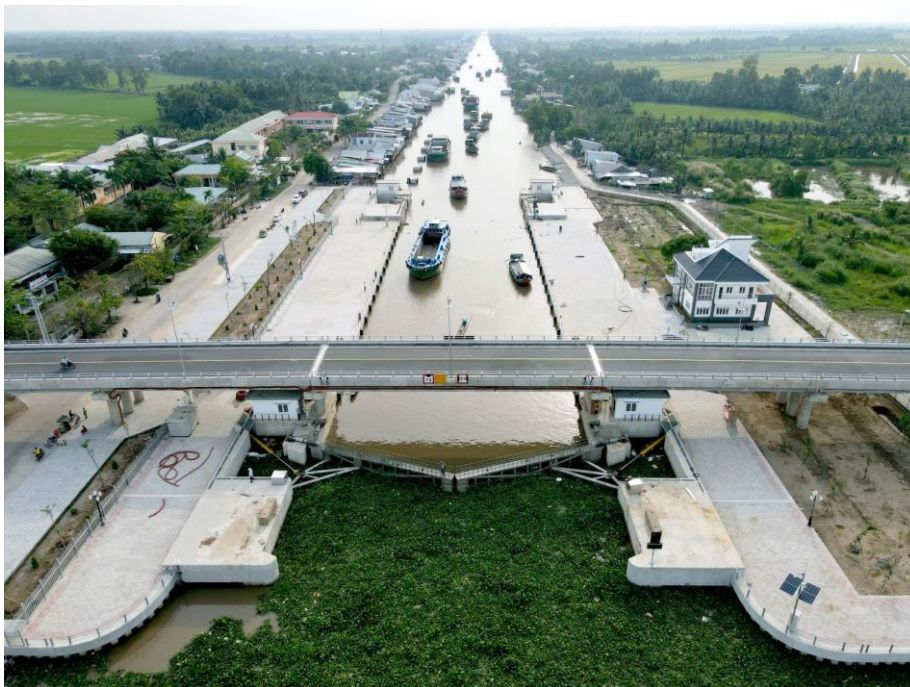
Công trình công Xẻo Rô khi hoàn thành.

Với công Xẻo Rô, việc bố trí kết cấu công trình theo phương án đã được phê duyệt trong giai đoạn nghiên cứu khả thi sẽ gây nhiều bất lợi, từ việc giải phóng mặt bằng, quá trình thi công cho đến quản lý, vận hành công trình sau này. Thậm chí sẽ không thể đảm bảo tiến độ chung của dự án. Chính vì vậy, các nhà khoa học của Viện Khoa học Thủy lợi Việt Nam đã nghiên cứu và đề xuất thay đổi phương án bố trí kết cấu công trình công Xẻo Rô so với phương án đã được Bộ Nông nghiệp và Phát triển Nông thôn phê duyệt. Phương án điều chỉnh đã thay đổi toàn bộ bố trí công trình bằng một hệ thống mới. Thiết kế giải pháp cống và âu thuyền kết hợp, công trình vận hành như một cống kiểm soát nguồn nước, kiểm soát mặn ngọt và kết hợp làm âu thuyền để cho phép tàu thuyền qua lại vị trí cống trong quá trình cống vận hành. Sáng kiến này đã được Bộ Nông nghiệp và Phát triển Nông thôn công nhận sáng kiến phạm vi ảnh hưởng cấp toàn quốc theo Quyết định số 4024/QĐ/BNN-TCCB ngày 14/10/2021.