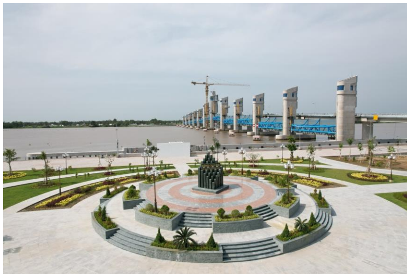
Công trình cống Cái Lớn thuộc hệ thống thủy lợi Cái Lớn - Cái Bé.

Công nghệ đập trụ đỡ đã được phân tích, lựa chọn ứng dụng để thiết kế phương án kết cấu công trình cho cống Cái Lớn và Xẻo Rô Trải qua quá trình nghiên cứu cải tiến và ứng dụng rộng rãi trên phạm vi toàn quốc, công nghệ này đã chứng minh được sự ưu việt, nhất là đối với các cống rộng và sâu như sông Cái Lớn.