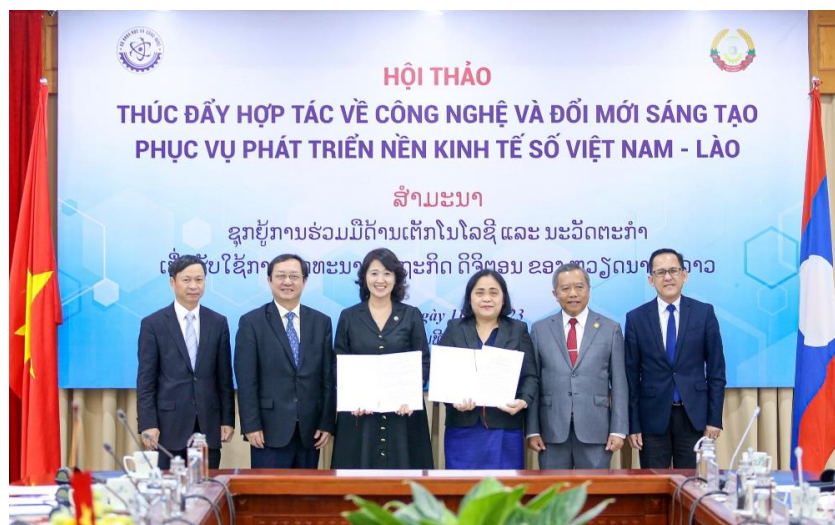
Lễ trao Bản ghi nhớ hợp tác giữa Cục Ứng dụng và Phát triển công nghệ Việt Nam và Trung tâm Xúc tiến và Chuyển giao công nghệ Lào.

Trong khuôn khổ Hội thảo đã diễn ra Lễ trao Bản ghi nhớ hợp tác giữa Cục Ứng dụng và Phát triển công nghệ Việt Nam và Trung tâm Xúc tiến và Chuyển giao công nghệ Lào.