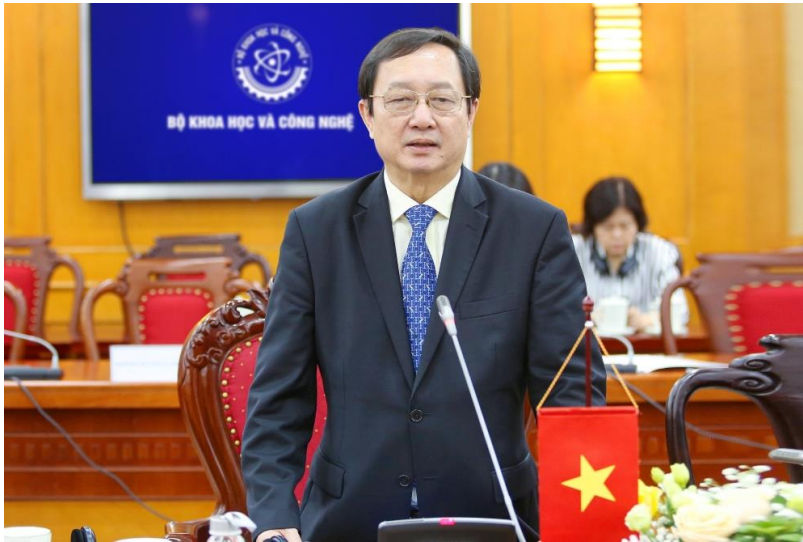
Bộ trưởng Huỳnh Thành Đạt phát biểu tại Hội thảo.

“Trong thời gian tới, hai bên sẽ ưu tiên nguồn lực đầu tư nhiều hơn nữa cho các hoạt động hợp tác nghiên cứu, ứng dụng, phát triển công nghệ và đổi mới sáng tạo. Trước mắt đề nghị các đơn vị của hai bên nhanh chóng trao đổi, xây dựng các nhiệm vụ hợp tác theo Nghị định thư trong lĩnh vực ứng dụng, chuyển giao công nghệ và đổi mới sáng tạo”, Bộ trưởng Huỳnh Thành Đạt nhấn mạnh.