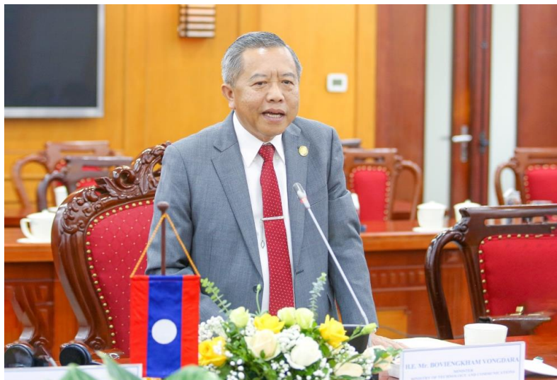
Bộ trưởng Boviengkham Vongdara phát biểu tại Hội thảo.

Bộ trưởng Boviengkham Vongdara gửi lời mời Bộ trưởng và các đồng chí lãnh đạo, cán bộ, công chức của Bộ KH&CN Việt Nam thăm Lào vào năm 2024, để trao đổi, chia sẻ kinh nghiệm với Bộ Công nghệ và Truyền thông Lào.