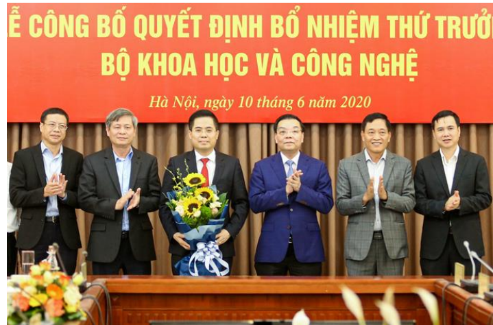
Bộ trưởng Bộ KH&CN Chu Ngọc Anh, lãnh đạo Bộ KH&CN tặng hoa chúc mừng.