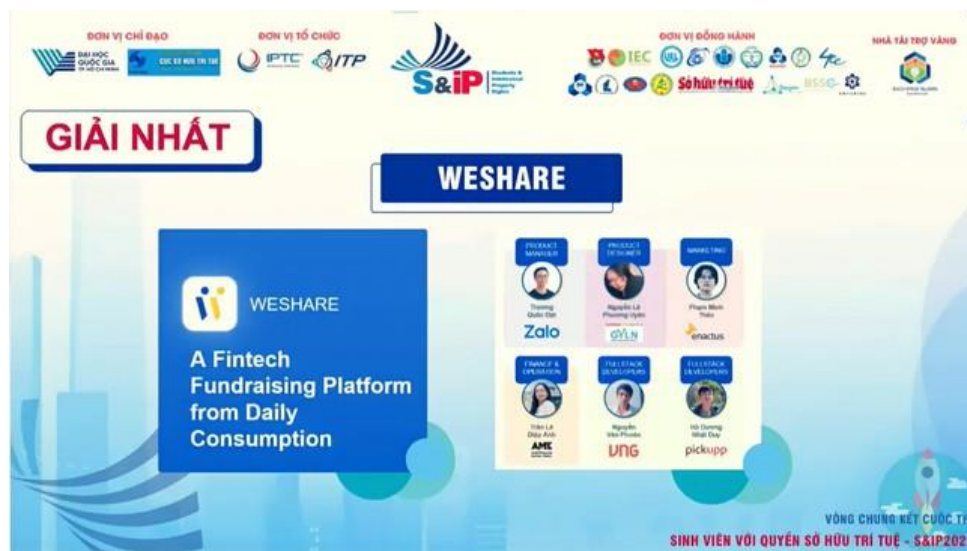
Dự án WeShare đoạt giải Nhất cuộc thi S&IP 2021