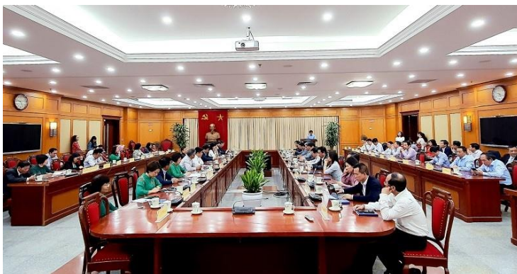
Toàn cảnh buổi Lễ.

Phát biểu tại buổi Lễ, thay mặt Ban cán sự Đảng, Bộ trưởng Huỳnh Thành Đạt chúc mừng và đánh giá cao những thành tích, quá trình rèn luyện, phấn đấu, công tác của các đồng chí được bổ nhiệm. Theo Bộ trưởng, năm nay là năm tiếp tục triển khai Chiến lược phát triển kinh tế - xã hội 10 năm, kế hoạch phát triển kinh tế - xã hội 5 năm và cũng là năm bắt đầu triển khai Chiến lược phát triển KH,CN&ĐMST, thực hiện tái cơ cấu các chương trình KH&CN cấp quốc gia. Bên cạnh đó, Bộ cũng đang tiếp tục đề xuất để hoàn thiện các chủ trương của Đảng về phát triển KH,CN&ĐMST. Hệ thống pháp luật về KH,CN&ĐMST cũng đang được rà soát, sửa đổi, bổ sung. Các quy hoạch căn cốt của ngành đang được gấp rút xây dựng. Bộ trưởng tin tưởng, với năng lực và kinh nghiệm công tác của mình, các đồng chí được điều động, bổ nhiệm ở các đơn vị sẽ luôn nỗ lực hoàn thành tốt mọi công việc được phân công.