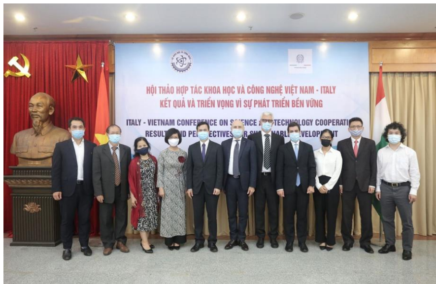
Thứ trưởng, Đại sứ, đại diện hai bên chụp ảnh chung với 5 nhà khoa học Việt có bài trình bày tại Hội thảo.