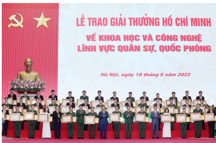
Chủ tịch nước Nguyễn Xuân Phúc, Phó Thủ tướng Vũ Đức Đam, lãnh đạo Bộ Quốc phòng, Bộ Khoa học và Công nghệ cùng đại biểu chụp ảnh lưu niệm với các tác giả đoạt giải thưởng.

Thay mặt cho tập thể và cá nhân được nhận giải thưởng cũng như đội ngũ cán bộ KH&CN trên cả nước, Bộ trưởng cũng bày tỏ lòng biết ơn chân thành và sâu sắc tới Đảng, Nhà nước, Chính phủ về sự quan tâm, động viên to lớn dành cho sự nghiệp phát triển KH&CN và bảo vệ tổ quốc, góp phần để các công trình khoa học đóng góp vào sự nghiệp phát triển kinh tế xã hội và bảo vệ đất nước vì một nước Việt Nam “dân giàu, nước mạnh, xã hội dân chủ công bằng văn minh”.