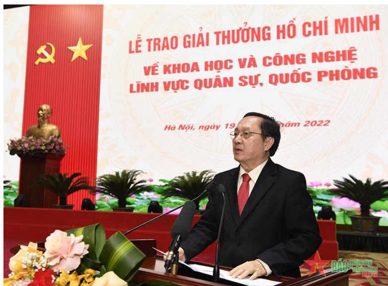
Đồng chí Huỳnh Thành Đạt, Bộ trưởng Bộ Khoa học và Công nghệ công bố quyết định trao Giải thưởng.

Nhân dịp này, Bộ trưởng Huỳnh Thành Đạt bày tỏ lời cảm ơn sâu sắc tới thành viên Hội đồng các cấp vì sự làm việc công tâm, tận tụy, khoa học, khách quan của các đồng chí; cũng như tới tất cả cán bộ đã tham gia phục vụ cho hoạt động của Hội đồng trong quá trình tổ chức xét giải thưởng.