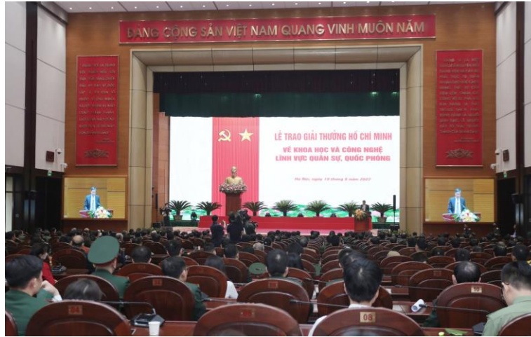
Toàn cảnh buổi Lễ.

Sáng 19/5, đúng kỷ niệm 132 năm ngày sinh nhật Chủ tịch Hồ Chí Minh và chào mừng Ngày Khoa học và Công nghệ Việt Nam 18-5, tại Hà Nội, Bộ Khoa học và Công nghệ (KH&CN) phối hợp với Bộ Quốc phòng tổ chức trọng thể Lễ Trao giải thưởng Hồ Chí Minh đợt 6 cho các đồng tác giả của hai công trình thuộc lĩnh vực quân sự, quốc phòng.