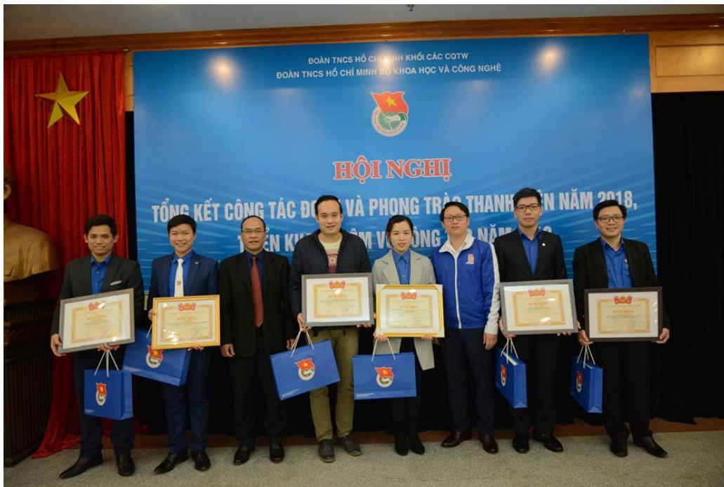
Các cá nhân nhận Bằng khen Trung ương Đoàn TNCS Hồ Chí Minh