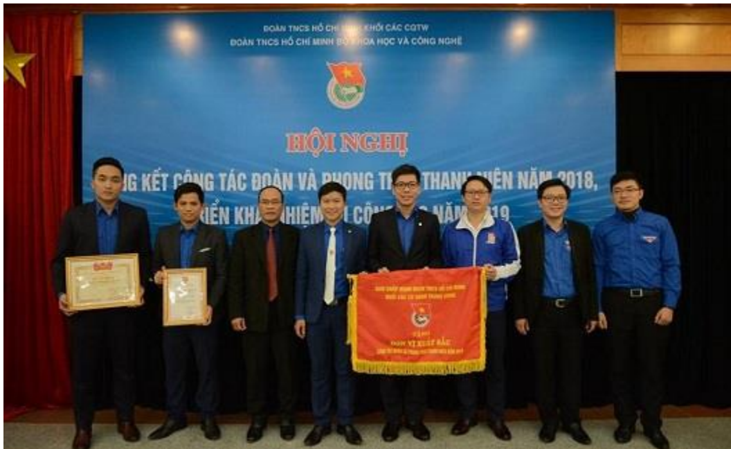
Ban Thường vụ Đoàn Bộ nhận Bằng khen của Trung ương Đoàn TNCS Hồ Chí Minh, Cờ Thi đua đơn vị xuất sắc cấp Khối, Mô hình, sản phẩm sáng tạo “Hệ thống tưới nước tự động” do Đoàn Khối các cơ quan Trung ương trao tặng