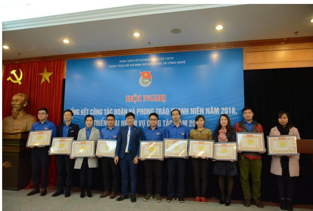
Đại diện các Chi đoàn nhận Giấy khen Đoàn Bộ về công tác Đoàn trong năm 2018