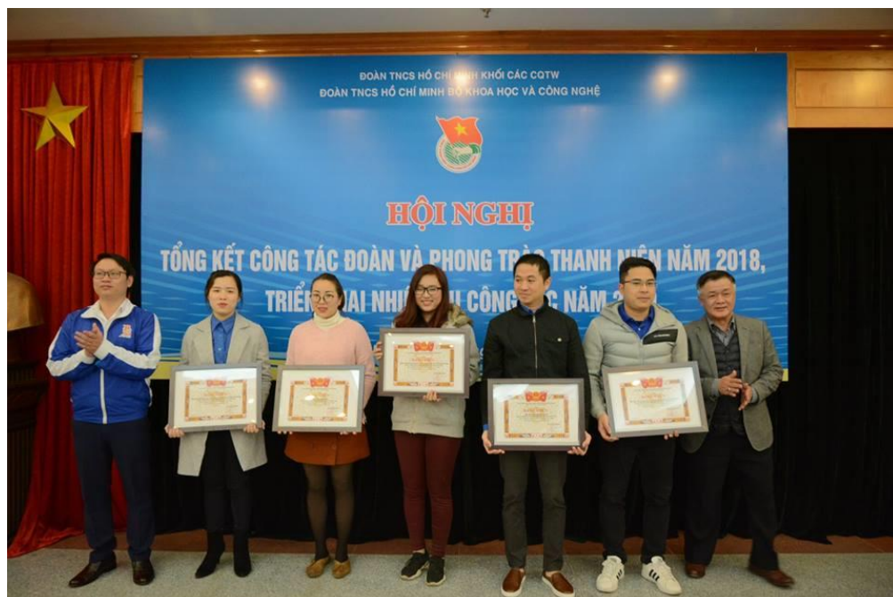
Đại diện các đơn vị nhận Bằng khen của Đoàn Khối các cơ quan Trung ương