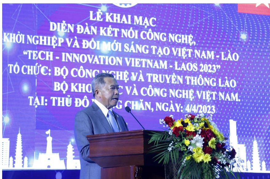
Bộ trưởng Bộ Công nghệ và Truyền thông Lào Boviengkham Vongdara phát biểu chào mừng tại Diễn đàn.