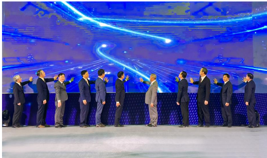
Nghi thức khai mạc Diễn đàn.

Chiều 4/4/2023, tại Trung tâm đào tạo quốc tế của Bộ Ngoại giao Lào, thủ đô Viêng Chăn (CHDCND Lào) đã diễn ra Lễ khai mạc Diễn đàn Kết nối công nghệ, khởi nghiệp và đổi mới sáng tạo Việt Nam - Lào 2023 (Tech - Innovation VietNam - Laos 2023). Đây là sự kiện do Bộ Khoa học và Công nghệ Việt Nam phối hợp với Bộ Công nghệ và Truyền thông Lào tổ chức.