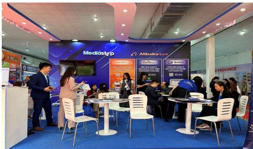
Gian trưng bày nền tảng bán hàng và phát triển kinh doanh toàn diện tại EXPO 2023