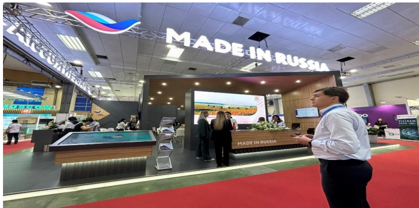
Gian hàng giới thiệu và kết nối giao thương công nghệ Liên Bang Nga

Theo chia sẻ của đại diện ban tổ chức, các đơn vị tham gia Hội chợ sẽ được đăng tải thông tin, hình ảnh, video doanh nghiệp lên nền tảng kỹ thuật số và thực hiện tương tác trực tiếp với khách tham quan không chỉ trong 4 ngày hội chợ mà hoạt động này còn được liên tục duy trì đến hết năm 2023 nhằm thu hút và tạo cơ hội cho những tổ chức thương mại, doanh nghiệp trong và ngoài nước được tham gia giao thương trực tuyến. “Quy mô trưng bày và thông điệp của EXPO 23 là tăng cường quảng bá, giao lưu và hỗ trợ xúc tiến thương mại. Các doanh nghiệp tham gia được chọn lựa chọn như Thực phẩm (xuất khẩu & trong nước); máy móc thiết bị tự động hóa. Cơ quan Phát triển Quốc tế Hoa Kỳ (USAID), thông qua Dự án Tăng cường năng lực cạnh tranh khu vực tư nhân Việt Nam (IPSC) đã hỗ trợ cho 20 doanh nghiệp nhỏ và đang tăng trưởng của Việt Nam tham gia trưng bày gian hàng giới thiệu sản phẩm và dịch vụ tại khu trưng bày thuộc Dự án Tăng cường Năng lực Cạnh tranh Khu vực Tư nhân Việt Nam – IPSC. Đây là các doanh nghiệp đã được nhận các hỗ trợ kỹ thuật thông qua Chương trình Mở rộng Thị trường do Dự án IPSC cung cấp”.