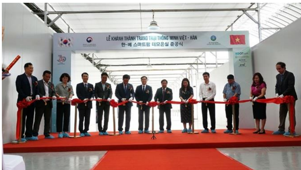
Các đại biểu cắt băng khánh thành trang trại thông minh Việt - Hàn

Mô hình trang trại thông minh Việt - Hàn chính thức được khởi công xây dựng trong khu thí nghiệm và trình diễn của VAAS từ ngày 4/12/2021. Mô hình do các chuyên gia Hàn Quốc thiết kế và sử dụng vật tư, trang thiết bị, máy móc, dụng cụ từ Hàn Quốc chuyển sang. Các chuyên gia Hàn Quốc cũng đã trực tiếp sang Việt Nam để lắp đặt và hướng dẫn vận hành. Qua hơn 6 tháng thực hiện, việc xây dựng trang trại đã cơ bản được hoàn thành với khu sản xuất và nhà điều hành rộng hơn 1,2 ha, được xây dựng khép kín bằng khung sắt lắp ghép sẵn và che phủ bằng lưới, bên trong lắp đặt các thiết bị như kệ trồng cây, hệ thống tưới tiêu, điều hòa nhiệt độ, bón phân tự động; phòng đào tạo, tập huấn, văn phòng làm việc, phòng máy, nhà kho, khu phụ trợ... Khu sản xuất đã được trồng dâu tây từ tháng 4/2022. Hệ thống nước tưới, điện đã được cung cấp đầy đủ phục vụ cho việc sản xuất và làm việc.