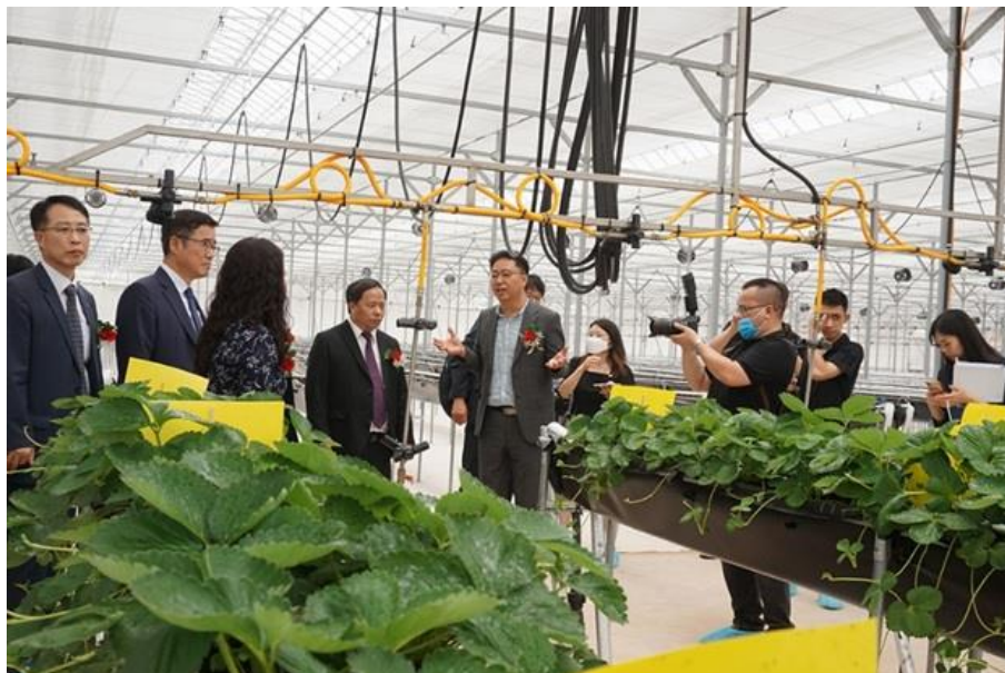
Các đại biểu tham quan mô hình trồng dưa tây.

Trong quá trình xây dựng và triển khai Dự án, hai đơn vị thực hiện dự án là KOAT và VAAS cũng đã xác định và thực hiện một mục tiêu quan trọng là nâng cao năng lực nghiên cứu và quản lý vận hành cho đội ngũ cán bộ khoa học và nông dân Việt Nam trong ứng dụng công nghệ thông minh vào sản xuất nông nghiệp thông qua khoá đào tạo đa dạng, với nhiều cấp độ và nhiều đối tượng học viên tham gia. Theo đó, các khóa tập huấn ngắn hạn và dài hạn về nâng cao năng lực quản lý và vận hành trang trại thông minh được Cơ quan Giáo dục, xúc tiến và dịch vụ thông tin về thực phẩm, nông lâm nghiệp và thủy sản Hàn Quốc (EPIS) và VAAS phối hợp tổ chức từ tháng 3/2022. Các học viên đến từ các đơn vị nghiên cứu của VAAS, các trường đại học và các doanh nghiệp trong lĩnh vực nông nghiệp. Trải qua thời gian học tập lý thuyết và thực hành tại trang trại, các học viên đã nắm bắt được kỹ thuật trồng và chăm sóc cây dưa tây, các kiến thức và kỹ năng quản lý và vận hành trang trại thông minh. Với nền tảng kiến thức tiếp thu trong quá trình học tập cộng với kinh nghiệm của bản thân, sau khi kết thúc khoá đào tạo này, các học viên có đủ khả năng quản lý, vận hành trang trại thông minh nói riêng và một số mô hình công nghệ cao nói chung trong sản xuất một số nông sản chủ lực, chất lượng cao.