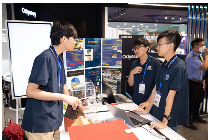
Tham gia Solve for Tomorrow, giới trẻ được 'trao quyền' tham gia vào quá trình kiến tạo tương lai, phát triển xã hội

Và vì thế, cuộc thi đã nhanh chóng thu hút được sự quan tâm của giới trẻ toàn cầu, trong đó có Việt Nam. Năm ngoái, cuộc thi đã thu hút được gần 400 bài dự thi sơ khảo từ 143 trường thuộc 14 tỉnh, thành phố trong cả nước.