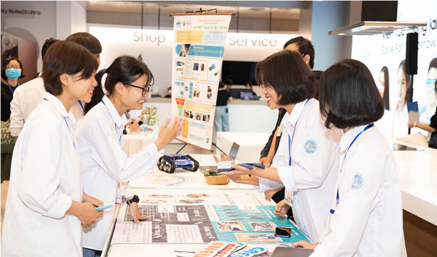
Solve for Tomorrow được tổ chức nhằm khuyến khích khả năng sáng tạo, ứng dụng công nghệ vào trong thực tiễn của giới trẻ