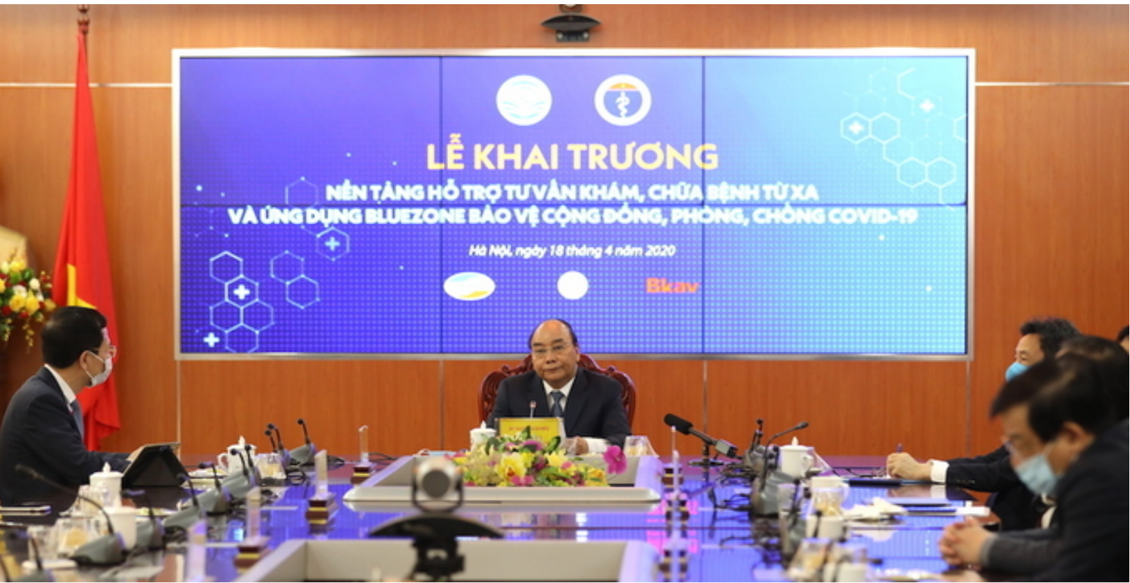
Danh sách startup đăng ký cung cấp giải pháp công nghệ hỗ trợ cộng đồng thông qua Văn phòng Đề án 844.