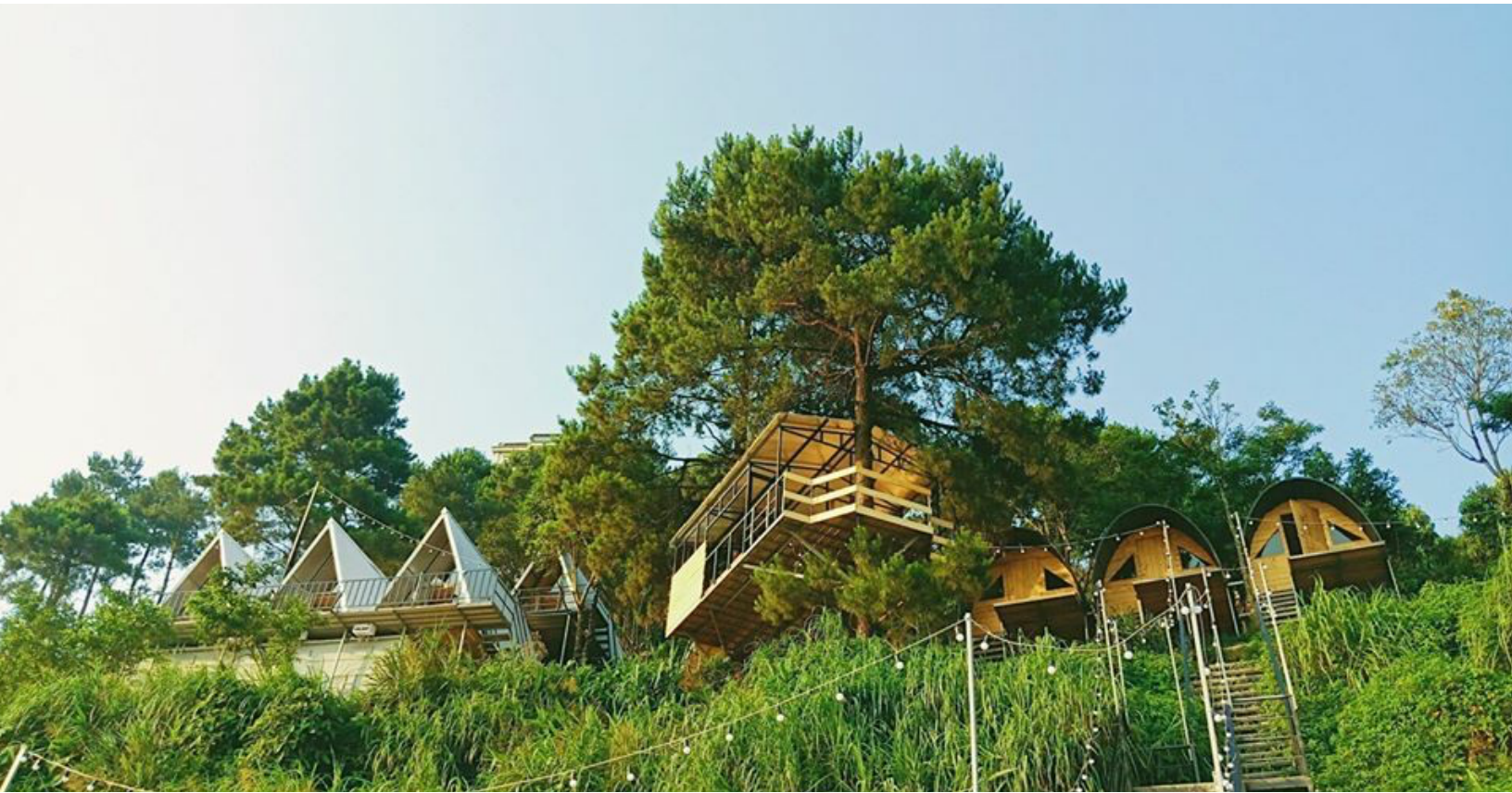
Những bungalow nằm bên sườn núi tại thị trấn Tam Đảo, Vĩnh Phúc.