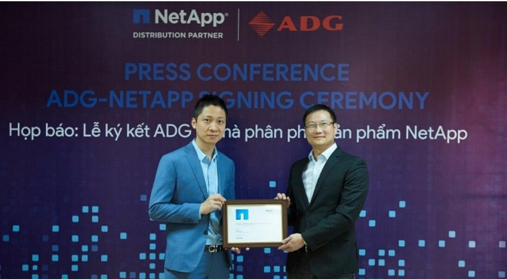
Ký kết hợp tác ADG Distribution là nhà phân phối các sản phẩm của NetApp tại Việt Nam