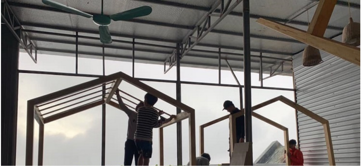
Những thành viên dự án chỉnh trang sảnh đón tiếp trong thời gian homestay đóng cửa.