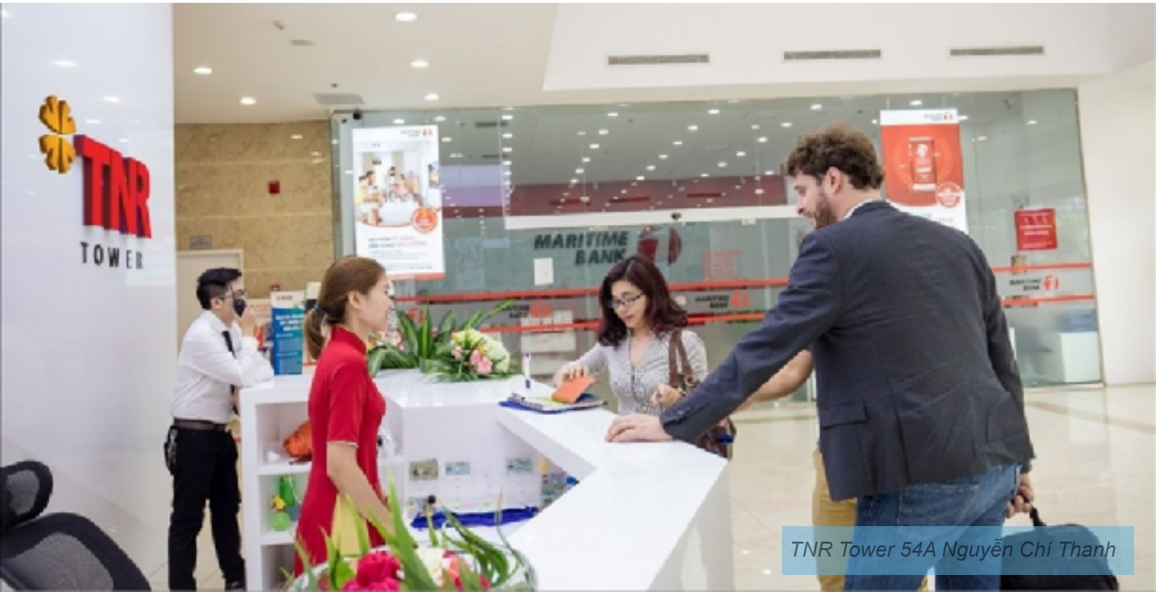
TNR Tower 54A Nguyễn Chí Thanh