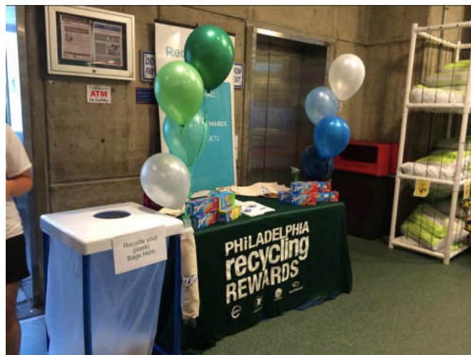
Recyclebank khuyến khích người dùng thực hiện các hành động xanh hàng ngày bằng các phiếu giảm giá và ưu đãi từ các doanh nghiệp địa phương và quốc gia.

pháp tiếp cận đổi mới, những công ty khởi nghiệp này có khả năng thay đổi cách thức hoạt động của chính phủ và giải quyết các vấn đề xã hội. Tuy nhiên, điều quan trọng là các nhà hoạch định chính sách, nhà đầu tư và công chúng phải tiếp tục hỗ trợ và nuôi dưỡng sự phát triển của các công ty khởi nghiệp này để đảm bảo sự thành công và tác động lâu dài của họ.