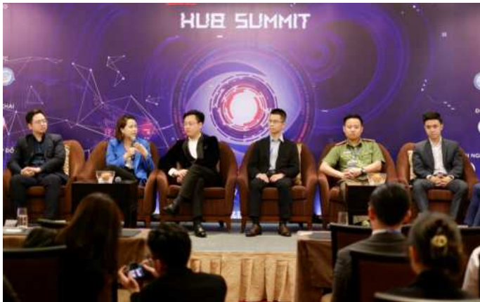
Một trong những sự kiện của Hub Challenge trước đây.

Đối tượng tham gia Hub Challenge 2024 là tất cả các dự án và doanh nghiệp khởi nghiệp Việt Nam trên toàn cầu trong tất cả lĩnh vực. Các đội thi sẽ được tham gia nhiều chương trình ươm tạo chuyên sâu, hợp tác cùng những chuyên gia hàng đầu trong nước cũng như quốc tế. Các đội thắng cuộc sẽ nhận được giải thưởng tiền mặt, cơ hội đầu tư từ các quỹ mạo hiểm quốc tế, cùng với gói hỗ trợ phát triển kinh doanh và ươm tạo từ Hub Network và các đối tác.