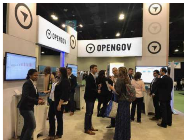
Với sứ mệnh hỗ trợ chính phủ hiệu quả và có trách nhiệm hơn, OpenGov phục vụ hơn 1.000 cơ quan trên khắp nước Mỹ.

Ngoài ra, vai trò của các công ty khởi nghiệp áp dụng chính sách công là thúc đẩy sự hợp tác giữa các bên liên quan khác nhau, bao gồm các cơ quan chính phủ, tổ chức phi lợi nhuận và các tổ chức tư nhân. Cách tiếp cận hợp tác này giúp phá vỡ các rào cản và khuyến khích giải quyết vấn đề liên ngành, dẫn đến các giải pháp chính sách toàn diện và toàn diện hơn.