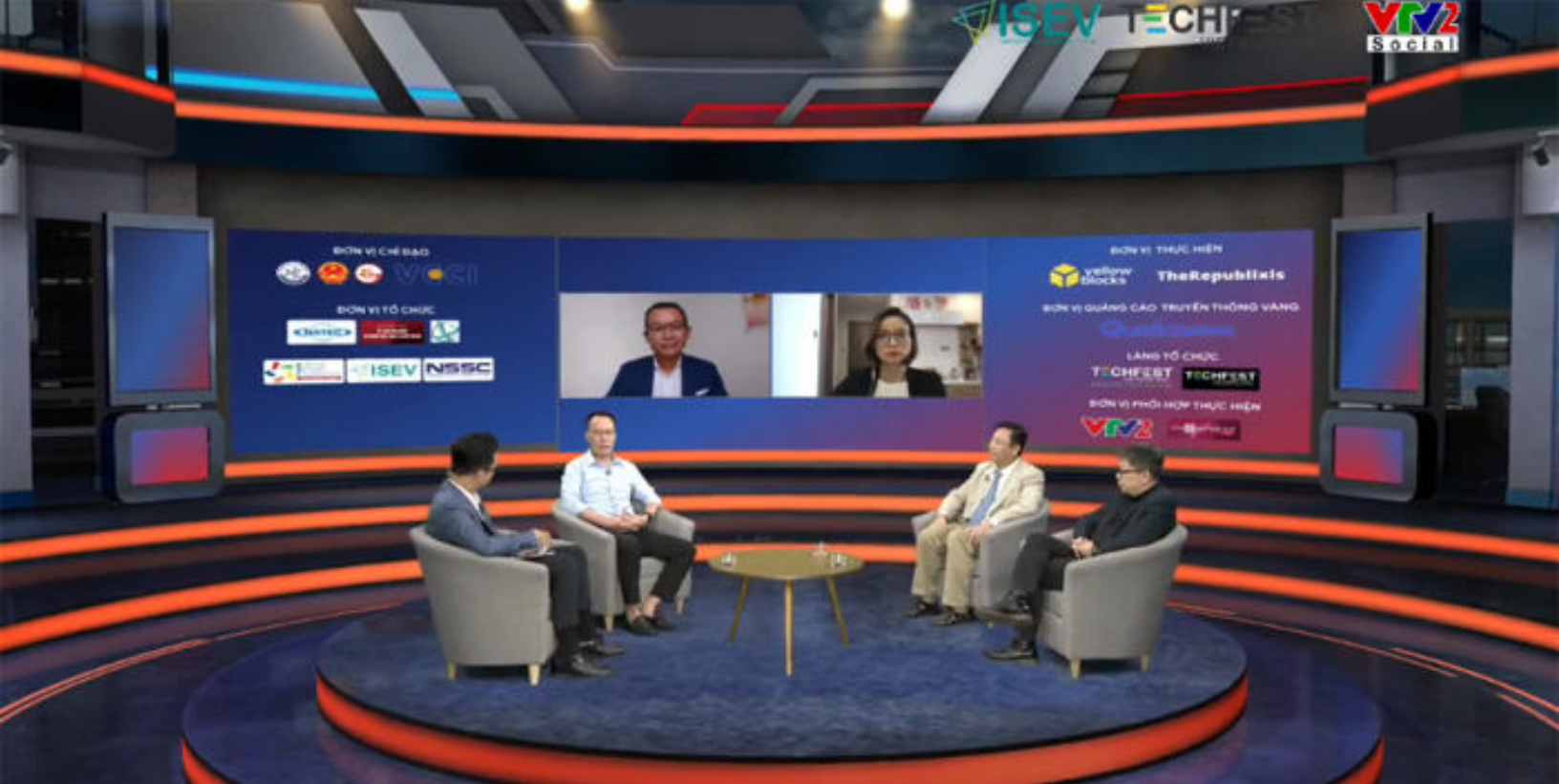
Các diễn ra tại tọa đàm Phá Bùng. Ảnh chụp màn hình