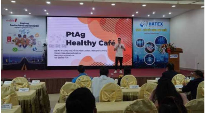
Đại diện Dự án PT Ag Healthy Café gọi vốn đầu tư tại sự kiện